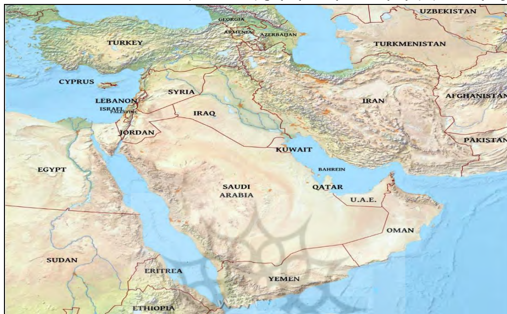
نقشه ۲ - مرزهای منطقه خاورمیانه

طی سال‌های پس از جنگ دوم جهانی کاربرد اصطلاح خاورمیانه به واسطه رونق روابط متقابل کشورهای خاورمیانه که به سبب مشترکات اسلامی - عربی فزونی می‌گرفت، رواج چشمگیری یافت. رفته رفته استفاده از اصطلاح خاورمیانه به کشورهای غیرعربی مانند ایران، ترکیه و اسرائیل هم گسترش یافت، چرا که این کشورها بنا به دلایل متعدد جغرافیایی - نظامی و اقتصادی (مسائل نفتی) با مجموعه کشورهای عربی روابط نزدیکی داشتند (Salehi, 2009: 10). دولت‌های مغرب (شامل الجزایر، تونس و...) ابتدا در محدوده خاورمیانه نبودند، اما در دهه ۱۹۸۰ میلادی و با ابلاغ اصطلاح جدید کشورهای خاورمیانه و شمال آفریقا توسط بانک جهانی و صندوق بین‌المللی پول شرایط جغرافیایی سابق خاورمیانه تغییر کرد و خاورمیانه در مورد محدوده وسیع‌تری به کار رفت (Abedi, 2009: 1۵).