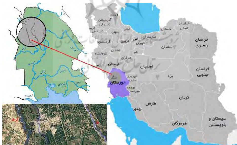
شکل ۱. موقعیت شهرستان شوش در ایران و استان خوزستان (فروغیان و همکاران، ۱۳۹۶: ۵۶-۷۱). موقعیت رودخانه‌های دز (سمت راست)، شاورر (وسط) و کرخه (سمت چپ)

از این رو این صنعت می‌تواند زندگی مردم را به سمت رشد و توسعه اقتصادی و کاهش فقر از طریق تأمین اقتصادی معیشت و برقراری صلح از طریق تبادلات و فهم فرهنگی تغییر دهد (ICAO, 2018: 18-19). در کنار مزیت‌های فراوان گردشگری رودخانه‌ای و سایر انواعی که به واسطه یک پهنه زیستی یا طبیعی شکل می‌گیرد؛ مشکلات زیست‌محیطی و از بین رفتن اکوسیستم‌های طبیعی به عنوان معضلی بزرگ در این باره مطرح است. نبود برنامه‌ریزی در توزیع جمعیتی گردشگران یا تسهیلات بهداشتی و ایمنی نقاط مقصد گردشگری موجب افزایش آلودگی‌های زیست‌محیطی خواهد بود؛ از این رو در پژوهش حاضر با انجام مکان‌یابی به عنوان فعالیتی که قابلیت‌ها و توانایی‌های یک منطقه یا ناحیه شهری را از لحاظ وجود زمین مناسب و کافی برای کاربردهای خاص مورد تجزیه و تحلیل قرار می‌دهد، به انتخاب مکان بهینه در جهت ایجاد و توسعه مرکز گردشگری رودخانه‌ای در محدوده مورد مطالعه پرداخته شده است. شاخص‌های