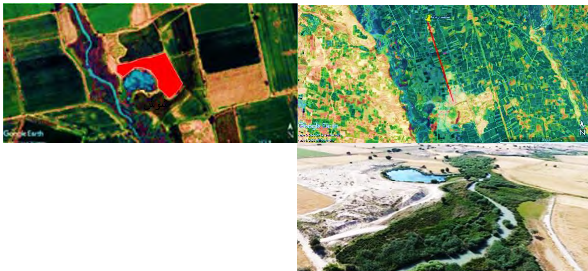
شکل ۲. موقعیت سایت رده‌ده نسبت به مرکز شهر شوش (بالا). محدوده سایت رده‌ده (وسط). نمای کلی از سایت و دریاچه طبیعی کناری (پایین)

کرخه واقع است. مناطق مسکونی نزدیک به آن چند روستا در شرق رودخانه و شهر فتح‌المبین (صالح مشطط) در ساحل غربی کرخه را شامل می‌شود (شکل شماره ۳). این سایت دارای ۹۱ متر ارتفاع از سطح دریاست.