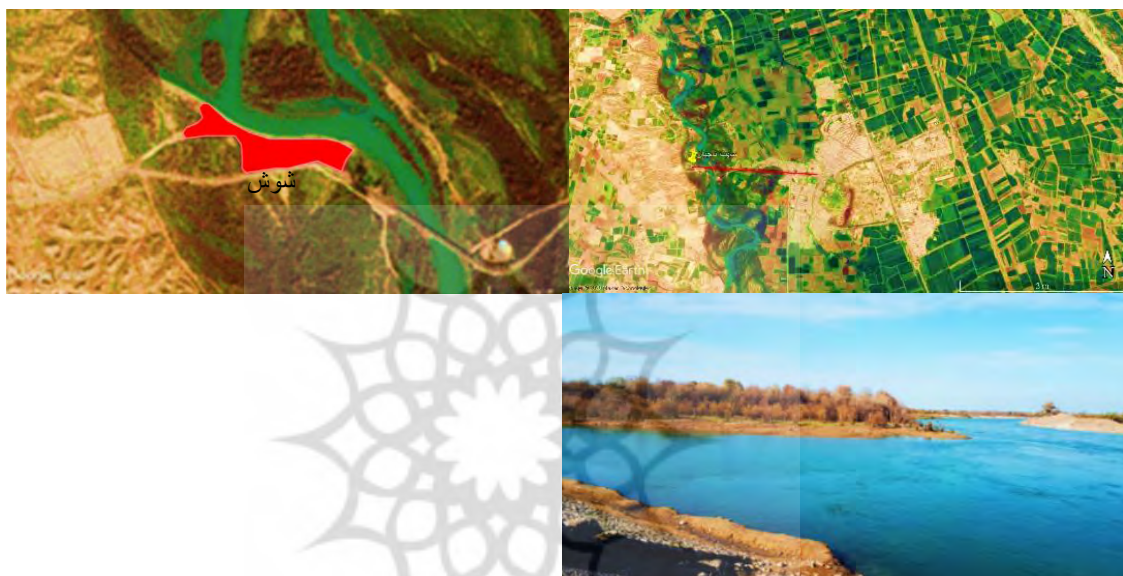
شکل ۴. موقعیت سایت ناجیان نسبت به مرکز شهر شوش (بالا). محدوده سایت ناجیان در کنار رود کرخه (وسط). منظر رود کرخه از

ایوان کرخه و یادمان شهدای فتح‌المبین قرار دارد. در این سایت تلاش‌هایی برای ساماندهی کناره رودخانه با عنوان «طرح ساحل‌سازی» صورت گرفته‌است (شکل شماره ۴). ارتفاع سایت مزبور از سطح دریا ۷۵ متر است.