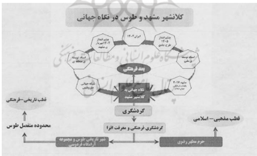
شکل ۲: جایگاه شهر مشهد و توس در اسناد فرادست و نگاه جهانی (غزنوی، ۱۳۹۶)

در سال ۱۳۸۳، منطقه ۱۲ درراستای توسعه شهر مقدس مشهد به سمت غرب با محدوده‌ای به وسعت ۲۱۵۴ هکتار و حریم به مساحت ۵۰۰۰ هکتار تعریف شد. در اردیبهشت سال ۱۳۹۲، محدوده منفصل توس که تا بهمن ماه سال ۱۳۹۱ به‌عنوان یکی از هفده روستایی بود که با تأیید قبلی شورای عالی معماری و شهرسازی کشور در تاریخ ۹۱/۱۱/۲۶ رسماً به‌عنوان یک محدوده منفصل شهری واقع در شمال غربی و به مساحت ۳۴۴۸ هکتار تعریف شده بود، به شهرداری مشهد و منطقه ۱۲ ملحق شد. اکنون، این منطقه با احتساب سه ناحیه، در مجموع با وسعتی بالغ بر ۵۶۰۰ هکتار، از لحاظ وسعت مقام اول را در بین مناطق دارد و حدود ۱۷ درصد کل شهر مشهد را به خود اختصاص داده است. این منطقه در راستای اجرای ناحیه‌محوری و تکریم ارباب رجوع و شهروندان، به ۳ ناحیه تقسیم شده است. جمعیت ساکن در محدوده این منطقه حدود ۸۹۷۸۷ نفر است که حدود ۳ درصد جمعیت مشهد به‌شمار می‌رود و تراکم جمعیتی آن حدود ۱۶ نفر در هکتار است. محدوده منفصل توس که اکنون به‌عنوان اداره ناحیه ۳ این منطقه در حال فعالیت است، شامل ۱۷ هسته جمعیتی است و حدود ۳۱،۵۰۰ نفر در آن ساکن هستند (غزنوی، سند راهبردی باززنده سازی توس، ۱۳۹۶).