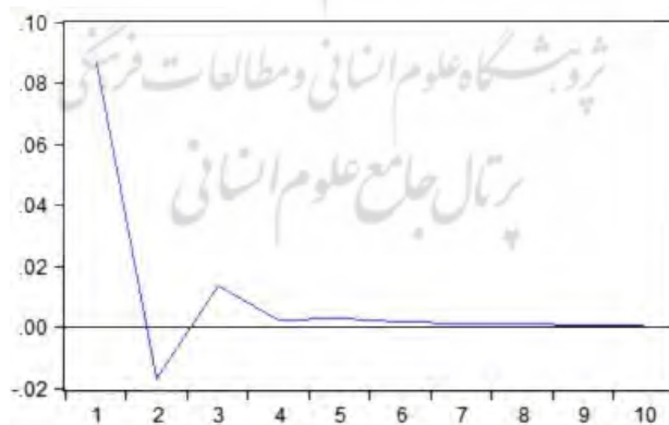
نمودار (۲): پاسخ تحقیق و توسعه به تکانه‌های دائمی بهره‌وری

نمودار (۲) نیز نشان می‌دهد که در لحظه‌ی رخ دادن تکانه‌های دائمی بهره‌وری کل عوامل تولید، نوسان‌های تحقیق و توسعه دارای مقدار ۰.۱٪ می‌باشد که در ادامه، اثر تکانه‌ها کاهش می‌یابد و در دوره دوم به کم‌ترین مقدار خود می‌رسد، اما بعد از دوره دوم تکانه‌های دائمی، روند نوسانی در رابطه با نوسان‌های تحقیق و توسعه داشته تا جایی که به سمت مقدار صفر همگرا می‌شود.