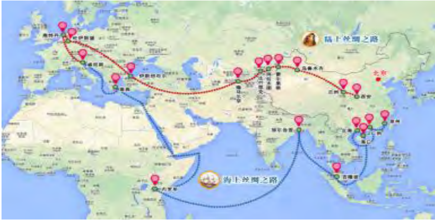
شکل ۲: مسیرهای اصلی جاده ابریشم

خط ممتد سرزمینی: جاده ابریشم زمینی نوین خط ممتد دریایی: جاده ابریشم دریایی نوین