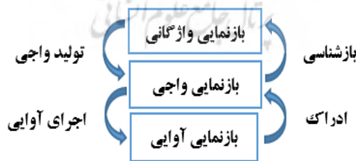
شکل ۱: مسیر فرایند شکل‌گیری دگرگونی آوا؛ برگرفته از هامن (Hamann, 2014)

دگرگونی واجی از دگرگونی آوایی ناشی می‌شود. برای دگرگونی آوایی، بازنمایی واژگانی با تولید واجی در قالب آوا بازنمون می‌گردد. هامن (Hamann, 2014, p. 9) این روند و پیوند را با شکل (۱) نشان داده‌است. پیش‌تر، برمودز-اوت‌هرو (Bermúdez-Otero, 2007; ) (quoted from Hamann, 2014) این بازنمایی‌ها را به ترتیب از بالا به پایین، رسم کرده و شرح سمت چپ شکل زیر (تولید واجی و اجرای آوایی) را بیان کرده بود، ولی، هامن (Hamann, 2014) فرایند وارونه‌ای که بیان‌گر نقش ادراک شنونده از بازنمایی آوایی و بازشناسی بازنمایی واجی در بازنمایی واژگانی (در سمت راست شکل) است، را در این رویه نشان داده‌است.