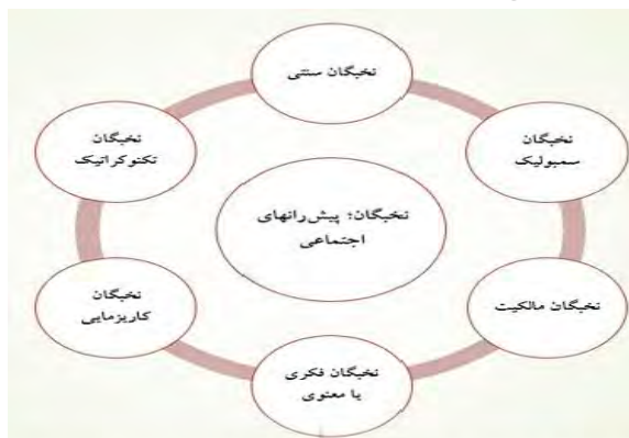
نمودار ۱-۲ نخبگان در نقش پیش‌ران‌های تحولات سیاسی-اجتماعی

به طبقه نخبگان سمبولیک اشاره کرده که در دهه‌های اخیر رفته رفته از اهمیت و نقش بسیار مهمی در سطوح مختلف معادلات اجتماعی برخوردار شده‌اند.