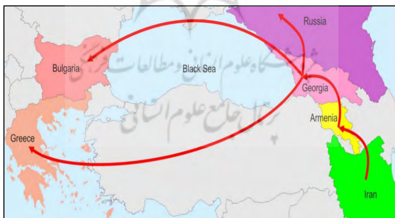
نقشه ۵. راهروی خلیج فارس و دریای سیاه

از دیگر مسیرهای انتقالی قفقاز جنوبی که مکمل رویکرد خوشه‌ای چین در منطقه است راهروی حمل‌ونقل چندوجهی خلیج فارس و دریای سیاه است که خلیج فارس را از راه ایران، ارمنستان، گرجستان و دریای سیاه به بلغارستان و یونان در اروپا متصل می‌کند. گفت‌وگوهای مربوط به این طرح از سال ۲۰۱۶ آغاز شده است. با توجه به اهمیت ایران در طرح کمربند راه، این طرح می‌تواند سبب اتصال ارمنستان به ابتکار کمربند راه از مسیر ایران (Poghosyan, 2018: 3) و کاهش انزوای ایروان شود. البته این مسیر نیز عملیاتی نشده است. نقشه ۵ نمایانگر این راهرو است.