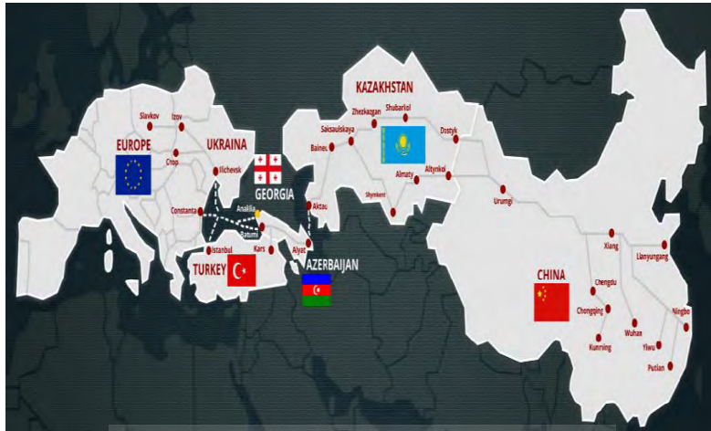
نقشه ۳. جاده مسیر حمل و نقل بین‌المللی و راجزر