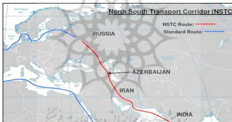
نقشه ۲. مسیر حمل و نقل شمال - جنوب

در چین ۱ است (Azertac, 2019; Huseynov, 2018: 84). بعد از افتتاح راه آهن باکو، تفلیس و قارص (نقشه ۴) در ژوئن ۲۰۱۷ اهمیت مسیر حمل و نقل آذربایجان برای چین دوچندان شده است. در این زمینه شاهین مصطفی یف، ۲ وزیر اقتصاد آذربایجان اعلام کرد که انتظار می رود از این پس ۱۰ تا ۱۵ درصد صادرات کالاهای چینی به اروپا از این مسیر عبور کند (Huseynov, 2018: 84). جمهوری آذربایجان می کوشد میان قدرت های حاضر در قفقاز جنوبی موازنه ایجاد کند. از این رو، نه در تنها در محور شرقی - غربی و مسیرهای انتقالی آن مشارکت دارد، بلکه خواستار همکاری نزدیک با ایران و روسیه برای ساخت راهروی بین المللی شمالی - جنوبی است (Poghosyan, 2018: 3). این رویکرد جمهوری آذربایجان با نگاه خوشه ای چین به قفقاز جنوبی هماهنگ است. در این زمینه رؤسای جمهور ایران، روسیه و جمهوری آذربایجان در باکو در سال ۲۰۱۶ برای اتصال خطوط ریلی سه کشور در قالب این طرح به توافق رسیدند (Ismailzade, 2016). نقشه ۲ این مسیر را نشان می دهد.