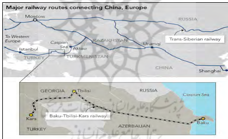
نقشه ۴. موقعیت ریلی چین و خط آهن باکو، تفلیس و قارص