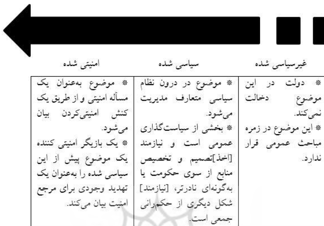
شکل ۱. طیف امنیتی کردن

می‌کند؟ ۱ تمرکز می‌شود» (Buzan & Wæver, 2003: 71).