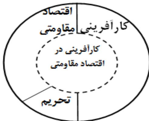
شکل ۱: حلقه کارآفرینی در اقتصاد مقاومتی

کارآفرینی در اقتصاد مقاومتی پدیده‌ای نوظهور، چندوجهی و پیچیده بوده که در حال تغییر و تکوین است و یک رویکرد به نوآوری، نظریه‌پردازی و الگوسازی در عرصه‌های جدید اقتصادی است. تفاوت این نوع کارآفرینی با کارآفرینی صرف در این است که مبنای کارآفرینی در اقتصاد مقاومتی، مبنایی ملی-ارزشی است که شرایط تحریم و سیاست‌های اقتصاد مقاومتی نیز در آن تأثیرگذار هستند (جدول ۱).