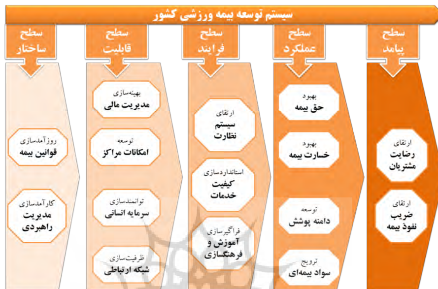
شکل ۱- مدل ساختاری پیشنهادی پژوهش (مستخرج از بخش کیفی سیستماتیک پژوهش)