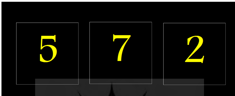
شکل ۲- نحوه ارائه محرک‌ها در نرم‌افزار ان-بک

اطلاعات، شاخص تغییرپذیری زمان واکنش در کوشش‌های صحیح به‌عنوان همسانی عملکرد و حفظ توجه در طول اجرای تکلیف به‌عنوان خروجی نتایج این آزمون بررسی شدند (۲۶).