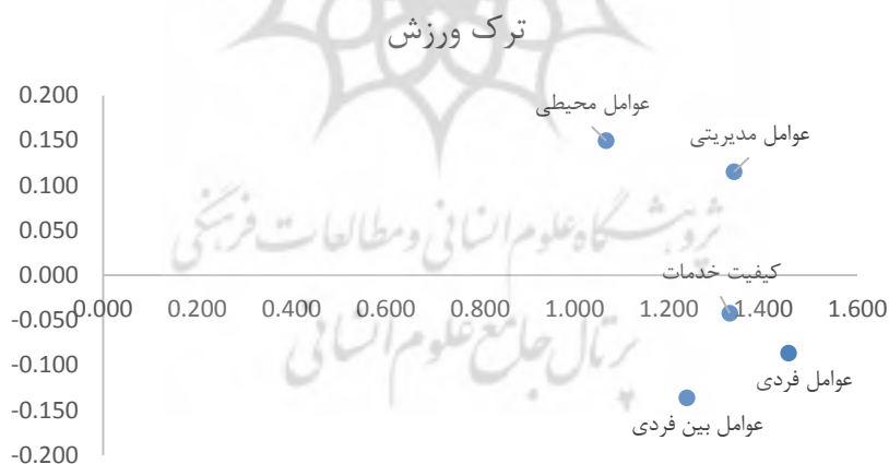
شکل ۱. نمودار عوامل مؤثر بر ترک ورزش بانوان

در مرحله هفتم پس از مشخص کردن مقدار حد آستانه (۰/۱۲۸)، نمودار IRM ترسیم شد.