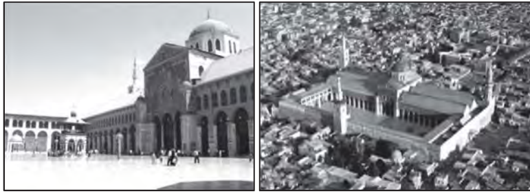
تصویر ۲: مسجد جامع دمشق و پلان مربوطه، ۷۱۵ - ۷۰۵ م.