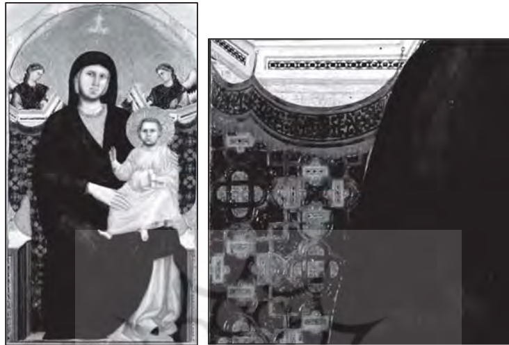
تصویر ۶: جوتو، ۳ مدونا و کودک، ۱۲۹۵ میلادی، رنگ و روغن روی چوب، فلورانس، موزه سنت استفانو، ۴

طراز به حاشیه‌ای اطلاق می‌شد که شامل خط و کتابت بود. این کتیبه‌ها یا در بافت پارچه بودند یا روی آن دوخته می‌شدند. ۱ این پارچه با شروع دوره اسلامی در کشورهای تحت حوزه دین اسلام پدیدار شد و می‌توان از آن به‌عنوان یکی از نمادهای هنر اسلامی یاد کرد. بعد از دوچو هنرمندان زیادی از طراز در آثار خود استفاده کردند (تصویر ۶) و این رسم تا دوره رنسانس ادامه یافت. پارچه‌های طراز در ایتالیا از اهمیت زیادی برخوردار بودند. با گسترش اسلام، طراز بافی، صنعت تولید پارچه‌های ابریشمی و منسوجات نفیس با کیفیت بالا در سایر نقاط عالم اسلام انتشار یافت و جزیره سیسیل نیز از آن مستثنی نبود. ۲