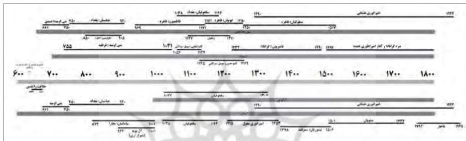
نمودار ۱: گسترش تمدن اسلامی در کشورهای مختلف و هم‌زمانی حکومت‌ها.

تاکنون محققین زیادی کوشیده‌اند که برای هنر اسلامی تعریف دقیقی ارائه دهند. برخی معتقدند که هنر اسلامی به معنی هنری است که در سرزمین‌های اسلامی آفریده شده است؛ ۱ برخی دیگر بر این باورند که هنر آفریده شده به دست هنرمندان مسلمان، هنر اسلامی است. ۲ با نگاهی به آثار هنری به‌جای مانده، می‌توان مشاهده کرد که هنر اسلامی میان شیوه‌ها و بیان‌های هنرمندانه محلی، و حال و هوای اسلام، نوعی هم‌زیستی ویژه پدید آورده است؛ همان چیزی که ژرژ مارسه ۳ - محقق فرانسوی هنر اسلامی - از آن با عنوان «شخصیت هنر اسلامی» یاد کرده است ۴ که در واقع ویژگی‌های مشخص و معرفه‌های این هنر هستند. تمدن اسلامی دارای هم‌زمانی در حکومت‌های زیادی است، به این معنی که در یک بازه تاریخی مشخص، حکومت‌های مختلفی بر سر کار بوده‌اند (نمودار ۱) که تمرکز همه آنها بر گسترش دین اسلام و گرایش مردم به این دین بوده است. ۵