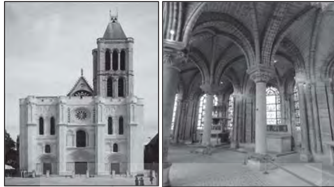
تصویر ۳: نمای بیرونی و داخلی کلیسای سنت دنی، ۱۱۴۴ م، پاریس.

شانزدهم میلادی در نظر گرفتند. ۱ این سبک هنری با ساخت دیر «سنت دنی» ۲ در ایل دو فرانس، ۳ در شمال پاریس در سال ۱۱۴۴ میلادی متولد شد و به تمام اروپا منتقل شد. گوتیک، مانند رومانسک، سبکی پیرو مذهب مسیحیت بود که شامل تمامی هنرهای آن دوران می‌شد: از معماری تا مجسمه‌سازی و از نقاشی تا هنرهای کاربردی. در یک دید کلی سبک گوتیک به معنی دور شدن از سنت‌هاست و اگر رومانسک به احیای سنت‌ها پایدار بود، گوتیک به دنبال از بین بردن آنها بود. ۴ بلندی کلیساها، طاق‌های جناغی، شیشه‌های منقوش و تزئینات بسیار زیاد، از ویژگی‌های کلیساهای این دوران به حساب می‌آیند. (تصویر ۳)