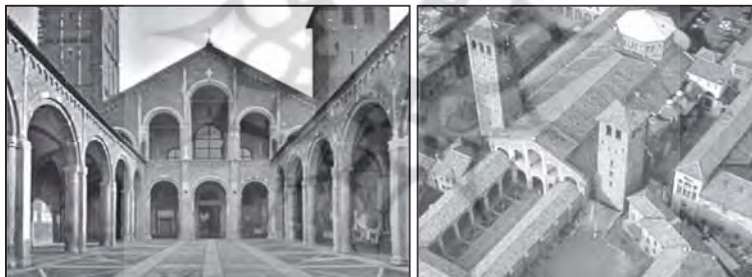
تصویر ۱: باسیلیکای سنت آمبروسیاناً و پلان مربوطه، میلان، ۱۰۹۹ - ۳۷۹م.

از معماری رومانسک به‌عنوان اولین معماری حقیقی متعلق به قرون وسطی یاد می‌شود که علی‌رغم تنوع، به‌سادگی قابل شناخت است. طاق‌های نیمه‌مدور و دیوارهای سنگین و تناور، مشخصه اصلی این بناها بودند ۲ که می‌توان از آنها به‌عنوان نقاط مشترک با معماری صدر اسلام یاد کرد. در این دوران تک‌تک ملت‌های مسیحی، در ساخت کلیساهای زیباتر و باشکوه‌تر با یکدیگر رقابت می‌کردند. ۳ یکی از مهم‌ترین بناهای به‌جای مانده از این دوران در کشور ایتالیا، باسیلیکای سنت آمبروسیاناً ۴ در میلان است (تصویر ۱) که به عقیده بسیاری از محققین، سبک معماری رومانسک در ایتالیا با ساخت آن به‌وجود آمده است. ساخت این کلیسا که یکی از قدیمی‌ترین کلیساهای موجود در شهر میلان است، در قرن چهارم میلادی آغاز شد و امروزه نیز بخش‌هایی از ساختمان اصلی در دسترس است. اما در قرن یازدهم میلادی و طبق قوانین معماری رومانسک، به شکل کنونی درآمد که می‌توان گفت از معماری اسلامی الهام گرفته است. ۵ برای درک بهتر شباهت‌های معماری رومانسک و معماری اسلامی، می‌توان این باسیلیکا را با مسجد جامع دمشق (تصویر ۲) مقایسه کرد.