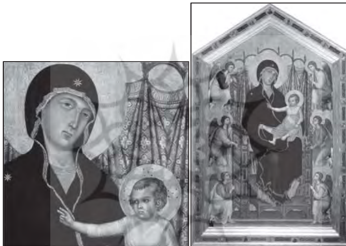
تصویر ۵: دوچو بونینسینیا، مدونا روچلای، ۵ ۱۲۸۵ میلادی، رنگ و روغن روی چوب،

نقاشی توسکانی موجود در این دوران را باید به‌عنوان تلفیقی از سنت‌های بیزانس دانست و با نگاهی ناتورتالیسم به موضوعات نقاشی بدان نگاه کرد. در این دوره، نقاشان به‌دنبال آن بودند که به حقیقت انسان‌گرایی و بعد مادی آن توجه بیشتری داشته باشند. ۱ با وجود آنکه در این دوران موضوعات نقاشی همگی مذهبی بودند (با تمرکز بر موضوعاتی مانند به صلیب کشیده‌شدن مسیح و مائستا) ۲ اما می‌توان مشاهده کرد که هنرمندان به تنظیمات نقاشی‌ها مخصوصاً در بازنمایی پیکر انسان براساس دنیای واقعی توجه داشته‌اند. آنچه که درباره نقاشی این دوره بسیار مورد توجه است، حضور (به تصویر کشیدن) پارچه‌های اسلامی در آثار هنرمندان است. ابریشم شرقی جزو کالاهایی است که به طرق مختلف (تجارت، غنیمت جنگی، هدیه سیاسی) وارد ایتالیا - و کل اروپا - شده است و مورد توجه هنرمندان بسیاری قرار گرفته است. ۳ یکی از قدیمی‌ترین نمونه‌های حضور پارچه شرقی در نقاشی ایتالیایی، مربوط به اثر دوچو بونینسینیا ۴ می‌باشد که از پارچه طراز در لباس حضرت مریم و پشت سر او استفاده کرده است. (تصویر ۵)