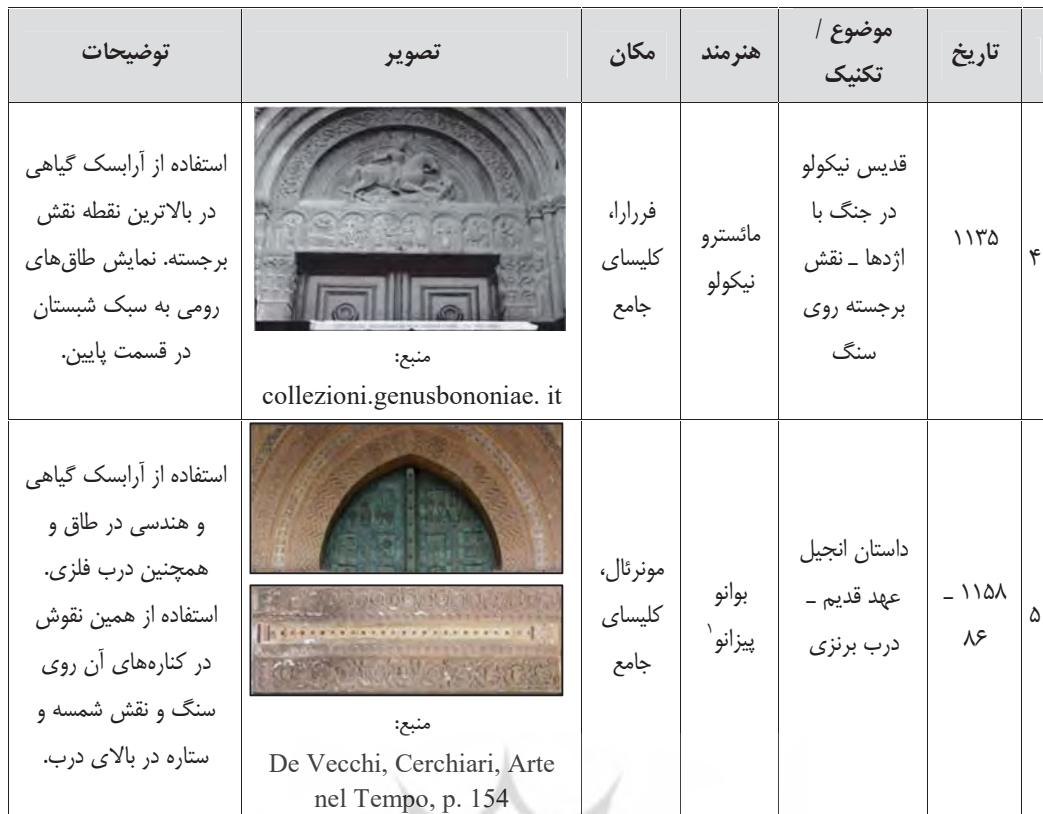
جدول ۲: حضور نقوش اسلامی در تزئینات معماری رومانسک در کلیساهای ایتالیا.

با بررسی جدول فوق می‌توان به تأثیر نقوش اسلامی بر معماری این دوران در ایتالیا به خوبی پی‌برد. بناهای فوق - چه در معماری و چه در مجسمه‌سازی - هیچ کدام به‌دست هنرمندان مسلمان ساخته نشده‌اند و از نظر جغرافیایی در حوزه کشورهای اسلامی قرار ندارند، اما همگی دارای معرفه‌های هنر اسلامی‌اند.