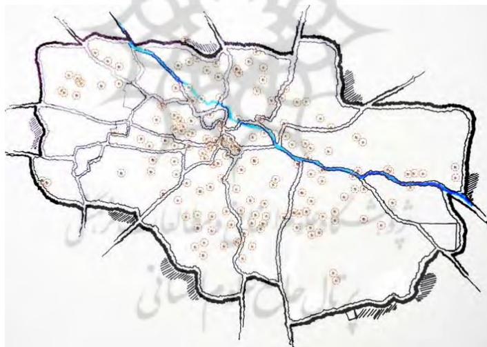
شکل (۵). نقشه‌ی فضای شنیداری با وضوح کامل (فاصله‌ی

۶۴متری) از صدای مساجد در دارالسلطنه‌ی تبریز