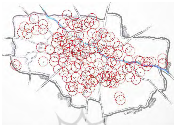
شکل (۶). نقشه‌ی فضای شنیداری با وضوح تقریبی (فاصله‌ی

۵۱۲متری) از صدای مساجد در دارالسلطنه‌ی تبریز