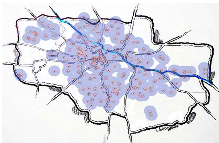
شکل (۷). بُرد صوتی صدای اذان در تبریز دوره‌ی قاجار تا محدوده‌ی شنوایی دقیق (بافر نانجی) و محدوده‌ی تفکیک اقامه‌ی اذان بدون تفکیک لغات و کلمات (بافر آبی)