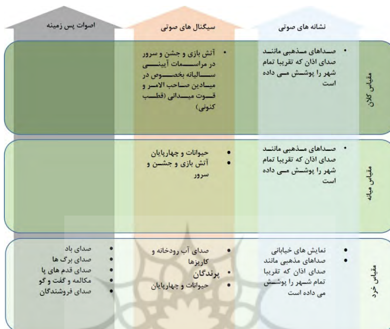
شکل (۶). نمودار منظر صوتی تبریز در دوره قاجار