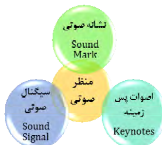
شکل (۱). مؤلفه‌های منظر صوتی از دید شافر

پاکروان با تحلیل رکورد مصاحبات باز از خاطرات صوتی افراد، اطلاعاتی درباره‌ی ادراک افراد از اصوات مختلف شامل سیگنال‌های صوتی و اصوات پس‌زمینه به دست آورده است. او ادعا می‌کند که «وقتی که نشانه‌های صوتی را در مصاحبات و مکالمات پیگیری کردم، فهمیدم که اطلاعات من تمایز روشنی بین فضاهای عمومی و خصوصی شامل فضاهای درونی، بیرونی، خانه‌ها، مغازه‌ها، مساجد و کنیسه‌ها برقرار کرد» (Pakravan, 2018, p. 4). تقریباً اکثر مطالعات، به‌نحوی با سه مؤلفه‌ی یادشده‌ی شافر سروکار دارند. والرین می‌گوید: «وقتی من درباره‌ی منظر صوتی حرف می‌زنم، به محیطی اشاره می‌کنم که با اصوات پر شده بود و من آنهایی را انتخاب کردم که اهمیت اجتماعی یا فرهنگی داشته‌اند؛ مانند سیگنال‌های صوتی» (Walraven, 2014, p. 21). البته با توجه به مفهومی که والرین به آن اشاره می‌کند، احتمالاً منظور نشانه‌های صوتی بوده است.