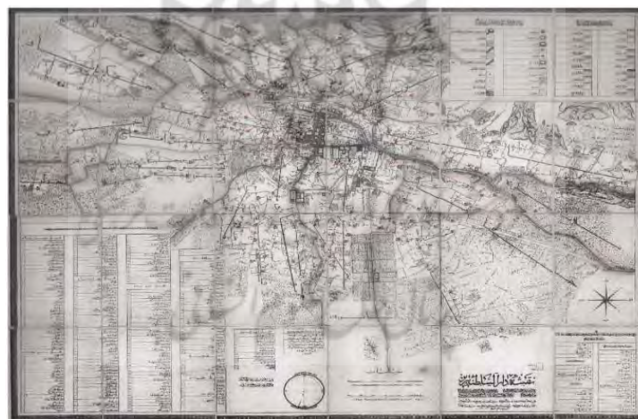
شکل (۴). نقشه‌ی دارالسلطنه‌ی تبریز در زمان قاجار و پراکنش مساجد

یکی از اسناد قدیمی موجود مینیاتور مطراقچی (فخاری تهرانی و پارسسی و امیربانی، ۱۳۸۵، ۱۴) از شهر تبریز است. با اتکا به این سند می‌توان کلیاتی از منابع شنیداری