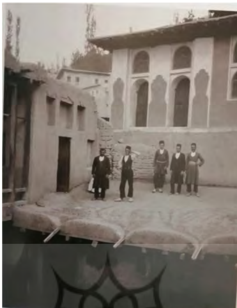
تصویر شماره ۵. چند مرد بر پشت بامی در نیاک - لاکهارت ۱۳۰۷/۱۹۲۸

بازتاب فقر در تصاویر عصر قاجار؛ آلبوم لارنس لاکهارت ... (نرگس صالح نژاد) ۲۱۷