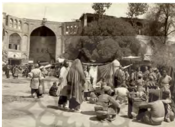
تصویر شماره ۱. بازار قیصریه - لاکهارت ۱۳۰۶ / ۱۹۲۷

«تمدن بلواری» رضاشاه قرار دارند، همچنان با فقر و نداری دست به گریبان هستند. تصویر شماره یک دقیقاً در دوره‌ای گرفته شده است که رضاشاه با شدت و سرعت تمام در حال پیش بردن کشور به سوی یک کشور متمدن بود (تصویر شماره ۱). آنچه در این تصویر و بسیاری دیگر از تصاویر لاکهارت به ثبت رسیده نه تنها نشانی از تمدن و مدرنیته پرسروصدای رضاشاهی ندارد، بلکه نشان‌دهنده فقر و فلاکتی ناشی از بی‌کفایتی حاکمان و شاهانی است که خود را سایه خدا در این مملکت می‌دانستند، ولی گام مثبتی برای بهبود زندگی مردم برنمی‌داشتند.