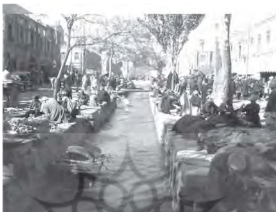
تصویر شماره ۴. منظره‌ای از پایین خیابان مشهد - لاکهارت ۱۳۲۷/۱۹۴۸

عادت‌واره‌ها از شرایط کودکی متأثر هستند، به تدریج نقش انطباق‌سازی با عملکردهای جامعه را به خود می‌گیرند (همان: ۴۷). نحوه اجتماعی شدن افراد در جامعه‌ای همانند ایران به آنان امکان رشد و فرارفتن از طبقه خود را نمی‌داد. فقر در جامعه ایران عصر قاجار و اوایل پهلوی سرنوشت محتومی بود که به فقرا اجازه رشد و رهایی از فقر را نمی‌داد.