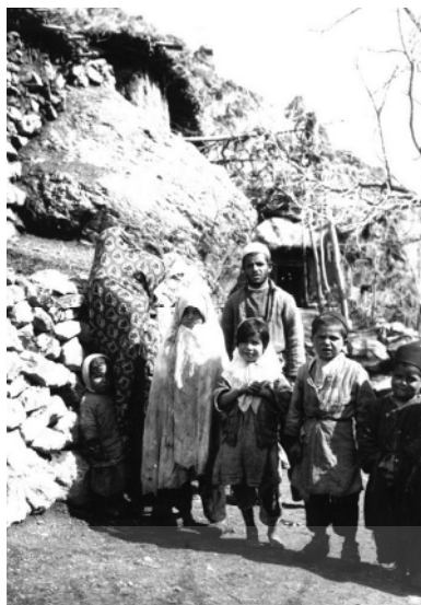
تصویر شماره ۳. خانواده‌ای در یکی از مناطق اطراف تهران- لاکهارت

عیسوی در کتاب تاریخ اقتصادی ایران سطح زندگی مردم را بسیار پایین و نامطلوب بیان می‌کند که «زندگی تمام دهقانان بر اساس کسب معیشت اولیه و فقیرانه‌ترین نوع غذا و وسایل زندگی بوده است» (عیسوی ۱۳۶۹: ۳۲؛ کدی به ۱۳۶۹: ۸۳). در تداوم عصر قاجار، در اوایل دوره رضاشاهی نیز وضع تقریباً به همین گونه است و اخبار و گزارش‌های مسافران و محققان خارجی از این عصر تغییرات چندانی را نشان نمی‌دهد و در برخی موارد نیز سخت‌تر شدن اوضاع برای مردم عادی را گزارش کرده‌اند. رژیم غذایی در یک خانواده معمولی دهقانی عبارت بود از نان و چای برای صبحانه، نان و ماست برای ناهار و نان و ماست و چای برای شام و در نهایت کدی نتیجه می‌گیرد «دهقانان غالباً گرسنگی می‌کشیدند». شرایط بهداشتی نیز نامطلوب گزارش شده است و اغلب روستاها فاقد امکانات بهداشتی هستند (فوران ۱۳۹۰: ۳۴۹). در مجموع وضعیت تحصیل، مسکن، بهداشت چندان مناسب گزارش نشده است.