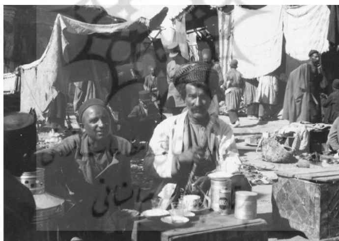
تصویر شماره ۶. نمایی از بازار - لاکهارت، بدون تاریخ