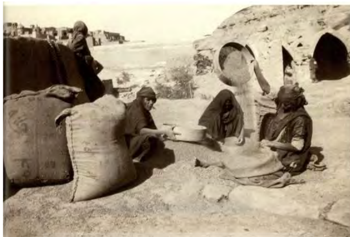
تصویر شماره ۳. زنان شوستر، ۱۳۲۷/۱۹۴۸

آنچه در تصاویر لاکهارت بازنمایی شده به موازات تمام مواردی است که مسافران در سفر به ایران شاهد آن بوده‌اند. منابع مکتوبی همانند این تصاویر سخن از فقری می‌گویند که ناشی از بی‌کفایتی دولت و حکومت است و مردم را در نداری و بی‌چیزی اسیر کرده است. «دیوارهای لخت و گلی کلبه‌ها، پوشاک محقرانه و چهره لاغر مردم نشانه‌های محرومیت و فلاکتشان بود» (فوران به نقل از ایست‌ویک ۱۳۹۰: ۱۹۴). این وضعیت را در تداوم عصر پهلوی نیز شاهد هستیم و به خوبی در تصاویری که لاکهارت ثبت کرده قابل مشاهده است (تصویر شمار ۳). در جامعه شهری ایران «خیابان‌ها و بازارهای شهرهای ایران خاصه مراکز بزرگ مملو از تهیدستان و بیکارانی است که آماده بودند در ازای تکه نانی برای دیگران کار کنند» (عبدالله‌یف ۱۳۶۹: ۷۴). در مجموع گزارش‌های موجود از این عصر از وخامت اوضاع زندگی مردمان طبقه پایین شهری حکایت دارد که به شدت آسیب‌دیده هستند. «تغذیه نادرست، کم‌بنیه، لاغر، لباس‌های کهنه و اغلب ژنده‌پوش نشان‌دهنده شرایط اسف‌بار زندگی مردم طبقه پایین است» (ابوت ۱۳۹۶: ۲۷۷).