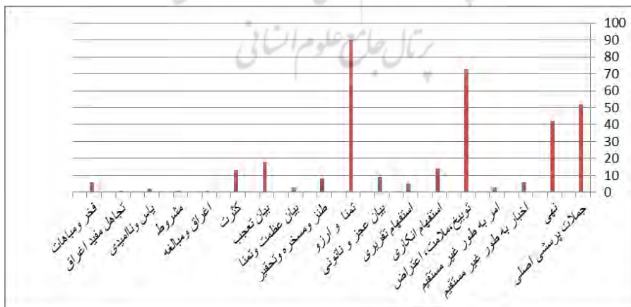
شوشگاه علوم جدول (۲) الغات فریبگی