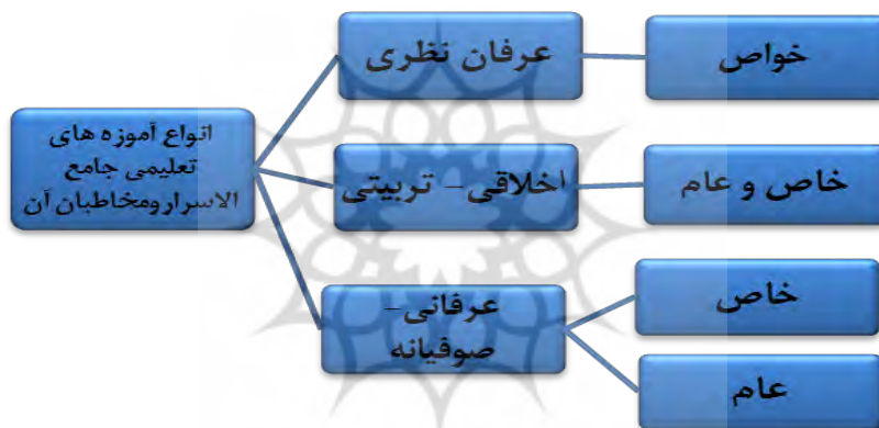
شکل ۱: انواع آموزه‌های تعلیمی جامع الاسرار و مخاطبان آن

برای جامع الاسرار، می‌توان حداقل سه گونه آموزه تعلیمی قائل شد که عبارت‌اند از: ۱. آموزه‌های عرفان نظری؛ ۲. آموزه‌های اخلاقی تربیتی؛ ۳. آموزه‌های عرفانی صوفیانه. نورعلیشاه برای هر کدام از آموزه‌های بالا مخاطبان زیر را در نظر داشته است: ۱. آموزه‌های عرفان نظری: برای خواص یا عارفانی است که با مفاهیم عرفان نظری و برخی مسائل فلسفی و اصطلاحات خاص مکتب محیی‌الدین ابن‌عربی آشنایی دارند. ۲. آموزه‌های اخلاقی تربیتی: برای خاص و عام هر دو قابل فهم و استفاده است. ۳. آموزه‌های عرفانی صوفیانه: بیشتر این آموزه‌ها برای صوفیه است اما آموزه‌هایی هم برای عوام وجود دارد.