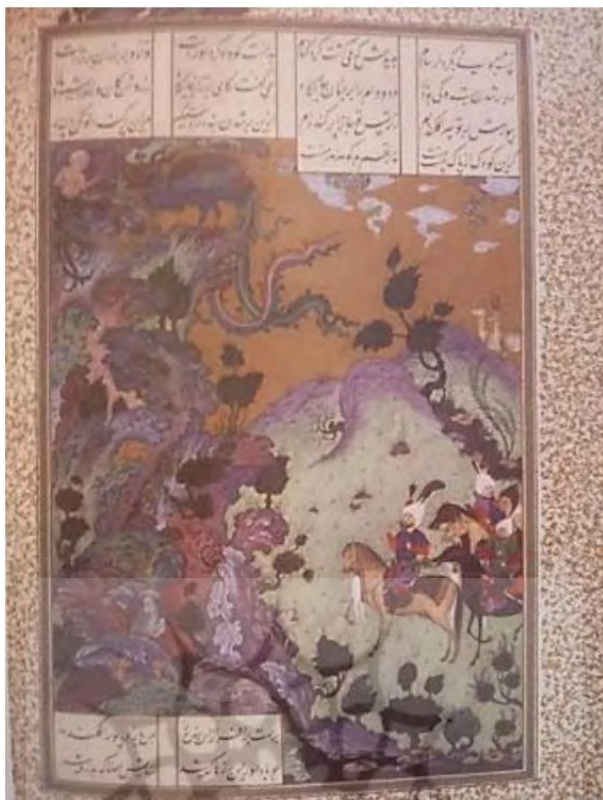
تصویر ۱: آمدن سام به کوهستان البرز، شاهنامه شاه طهماسبی، (۹۳۱-۹۴۳ق)، موزه برلین.

این سبک مدیریتی در صورتی که در شرایط مناسب به کار رود، اثربخش و مدیر به نام مدیر «رشد دهنده» نام می‌گیرد. ولی اگر این سبک رفتاری در شرایط نامناسب به کار رود و در نتیجه غیر اثربخش باشد؛ مدیر به نام «مدیر مطیع یا موعظه‌گر» نامیده می‌شود. ضمناً در این بخش، شاهد نمود روابط انسانی در مدیریت هستیم که همچون سیستم درونی، سازمان حکومت را تحت تأثیر خود قرار می‌دهد. سبک‌های رابطه‌مداری تحت عنوان سبک‌هایی که در آن مدیر حداقل گرایش به وظیفه و یا کار و حداکثر گرایش به رابطه یا فرد را داراست، بررسی می‌شود.