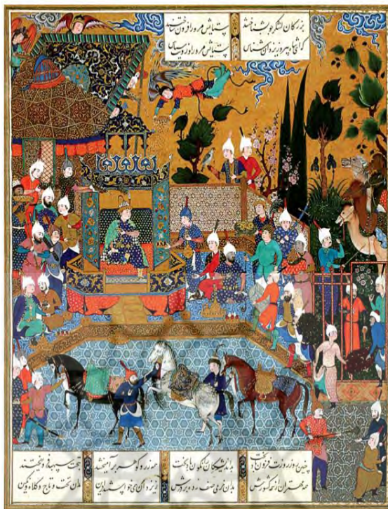
تصویر ۲: نگاره دربار فریدون، شاهنامه شاه طهماسبی.

در تصویر شماره (۲) که نمایی از دربار فریدون است به ارتباط گسترده فریدون با درباریان صحنه می‌گذارد و تا حدی روشن کننده سبک مدیریت او است. رهبری دموکراتیک یکی از مؤثرترین انواع سبک مدیریت است، زیرا اجازه می‌دهد تا مدیرانی که سطح توانایی پایینی دارند، هم بتوانند در تصمیمات خاص مورد استفاده قرار گیرند. کارکرد مدیریتی مهم زو، واگذاری بخشی از ایران به توران با مشارکت فرماندهان در تصمیم‌گیری‌ها بود که باعث صلح با تورانیان به سبب خشکسالی شد. تغییری که برای بهبود اوضاع و در دست گرفتن بهتر زمام امور، برای پنج سال که بخت کند رو با او یار شده بود، انجام می‌دهد و از پس آن باران فرو می‌بارد و همه جا سرسبز می‌شود: