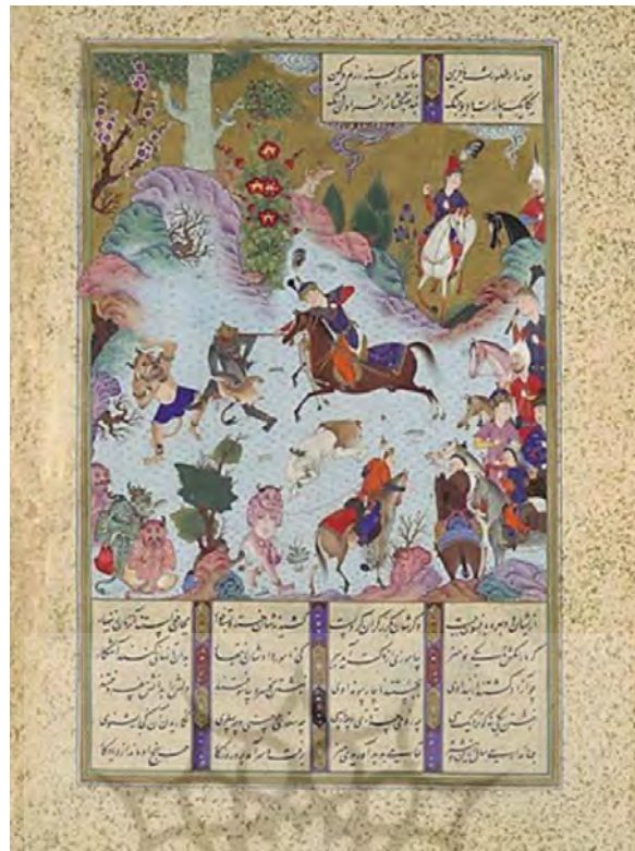
تصویر ۵: نگاره طهمورث در نبرد با دیوان، شاهنامه شاه طهماسبی، ۹۳۲ق، منبع: (حقایق، شایسته‌فر، ۱۳۹۳: ۵۷).

فریدون هم اهداف حکومتی خود را اینگونه بیان می‌کند: