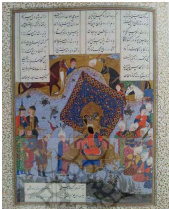
تصویر ۴: نگاره خواستاری کیکاوس، رستم را به جنگ سهراب، شاهنامه شاه طهماسبی (فغوری، بلخاری قهی، ۱۳۹۲: ۱۰).

تصویر شماره (۴) بخشی از آشفتگی سیاسی این دوره را به تصویر کشیده است. در این میان دوره حکمرانی کاووس، پر از نوع مدیریتی بی‌نظمی و آشفتگی است. نوع عملکرد سیاوش و کیخسرو در این محدوده زمانی، تداعی‌کننده نوعی نظم خاص در حالت بی‌نظمی است. سیاوش نه تنها، پیام‌آور مهر و محبتی انسانی در نظام مدیریت با اعمال سبک مدیریت استبدادی، خشک و یک‌سویه‌نگر است، برای گریز از آشفتگی، با هشیاری نظام مدیریتی فعال و کارآمدی را در اندرون نظام پوسیده افراسیابی و کاووسی پیشنهاد می‌کند. این نوع مدیریت نهایتاً به تضعیف تمرکز کارکنان و گم کردن هدف ختم می‌شود، که کم‌کم به نارضایتی هرچه بیشتر و تصویری ضعیف از مدیریت ختم می‌شود. در واقع از دیدگاه سبک‌های مدیریتی، عملکرد سیاوش قیام علیه نظام حکومتی آشفته و بی‌سامان است که قصد بهبود اوضاع را ندارد و در قید و بند سنن خشکیده و جامد خودش، بی‌تحرک مانده و اگر حرکتی از او سر می‌زند، همه‌اش به ضرر و زیان انسان و کارکرد اداری او است که مدیریت را برای بهبود اوضاع خویش وضع کرده است نه برای تسلیم شدن و خشکیدن و ناتوانی. به نظر می‌رسد، سبک مدیریتی سیاوش، به تمام و کمال مادی و این‌دنیایی است و قابل اجرا هم هست، او گاه با اعمال سبک مدیریت پدران و بخشیدن استان‌های مختلف ایران پس از غلبه بر توران به فرماندهان جنگ و بهره‌مند ساختن مردم از غنایم و امنیت و فراوانی، درکنار گرایش به عبادت و سرانجام معراج گونه‌ای که تکلیف مدیریت را با گذاشتن جانشینی به نام لهراسب رقم می‌زند، در واقع پاسخی به این مسأله است که مدیریت مملکتی باید تابع شیوه عملی و کارآمد از میان سنن پیشین باشد و همچنین با نقش پدران بر ساز کارهایی نو بنیاد