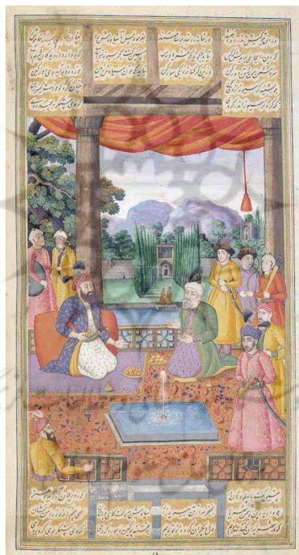
تصویر ۳: نگاره مشورت افراسیاب با برادرش گرسیوز، شاهنامه شاه طهماسبی.