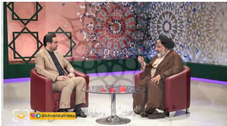
تصویر ۳: برنامه خوشبخت از شبکه قرآن. منبع: (نگارنده).

در یک رویکرد ترکیبی می‌توان سبک زندگی را مجموعه‌ای از عادت‌واره‌های افراد دانست که در برگزیده‌ی طرح‌ها و الگوهای زندگی افراد است که آن‌ها را در طول زندگی و از ابتدای تولدشان براساس برخورد با محیط، خانواده و رسانه‌ها و گروه همسالان کسب می‌کنند اما سبک زندگی اسلامی به رفتار می‌پردازد و با شناخت‌ها و عواطف ارتباط مستقیم ندارد، لکن از آن جهت که اسلامی است، نمی‌تواند بی‌ارتباط با عواطف شناخت‌ها باشد. بر این اساس در سبک زندگی اسلامی، عمق اعتقادات و عواطف و نگرش فرد سنجیده نمی‌شود، بلکه رفتارهای فرد مورد سنجش قرار می‌گیرد، لکن هر رفتاری که بخواهد مبنای اسلامی داشته باشد، باید حداقل‌هایی از شناخت‌ها و عواطف اسلامی را پشتوانه خود قرار دهد». در سبک زندگی اسلامی، رفتارهای فرد مورد سنجش قرار می‌گیرد و هر رفتاری که بخواهد مبنای اسلامی داشته باشد، باید حداقل‌هایی از زیربنای شناختی و عاطفی اسلامی را داشته باشد و در نهایت می‌توان گفت که سبک زندگی اسلامی تمام ابعاد زندگی (از ابتدا تا انتها) را دربر می‌گیرد (کاویانی، ۱۳۸۸: ۵-۱۷). تصویر شماره ۳ نیز از جمله برنامه‌های قرآنی شبکه قرآن است که نقش مهمی در ترویج سبک زندگی اسلامی دارد.