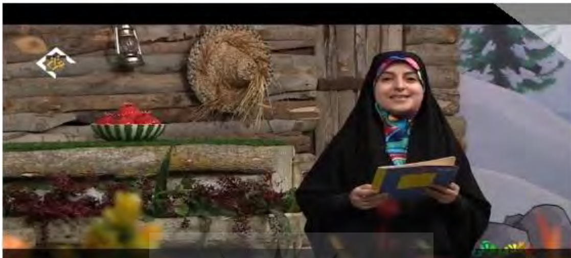
تصویر ۴: برنامه نوگلان قرآنی، شبکه قرآن.

اجتماعی، رسانه‌های جمعی می‌باشند. برنامه‌های قرآنی تلویزیون به کودکان نیز توجه دارد، تصویر شماره ۴، برنامه نوگلان قرآنی از شبکه قرآن اشاره دارد.