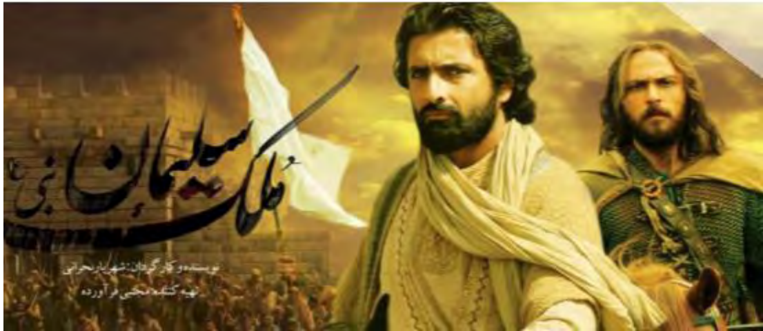
تصویر ۱: فیلم حضرت سلیمان. کارگردان شهریار بحرانی

تلویزیون با استفاده از قابلیت‌های منحصر به فرد توانسته در متن زندگی افراد حضور یابد و دیگر اشکال رسانه را چون سینما و کتاب و ... به حاشیه براند. بیشتر افراد جامعه وقت زیادی را صرف تماشای تلویزیون می‌کنند (بنی‌هاشمی، خلیلی، ۱۳۹۳: ۱۵۸). با توجه به این تأثیرگذاری ضرورت پردازش ویژه در برنامه‌های مختص تلویزیون و تولید برنامه‌های مطابقت با فرهنگ اسلامی و انگاره‌های مورد توجه آن مطرح می‌گردد. ساخت برنامه‌هایی که مستقیماً به آموزش مفاهیم قرآنی می‌پردازد نیز در تلویزیون قابل مشاهده است. برنامه درس‌هایی از قرآن یکی از این برنامه‌هاست که تصویر شماره (۲) به آن اشاره دارد.