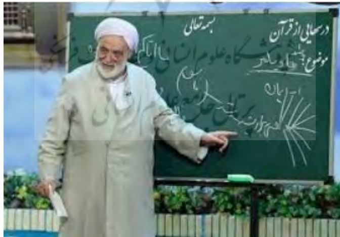
تصویر ۲: برنامه درس‌هایی از قرآن. شبکه یک.

تلویزیون با استفاده از قابلیت‌های منحصر به فرد توانسته در متن زندگی افراد حضور یابد و دیگر اشکال رسانه را چون سینما و کتاب و ... به حاشیه براند. بیشتر افراد جامعه وقت زیادی را صرف تماشای تلویزیون می‌کنند (بنی‌هاشمی، خلیلی، ۱۳۹۳: ۱۵۸). با توجه به این تأثیرگذاری ضرورت پردازش ویژه در برنامه‌های مختص تلویزیون و تولید برنامه‌های مطابقت با فرهنگ اسلامی و انگاره‌های مورد توجه آن مطرح می‌گردد. ساخت برنامه‌هایی که مستقیماً به آموزش مفاهیم قرآنی می‌پردازد نیز در تلویزیون قابل مشاهده است. برنامه درس‌هایی از قرآن یکی از این برنامه‌هاست که تصویر شماره (۲) به آن اشاره دارد.