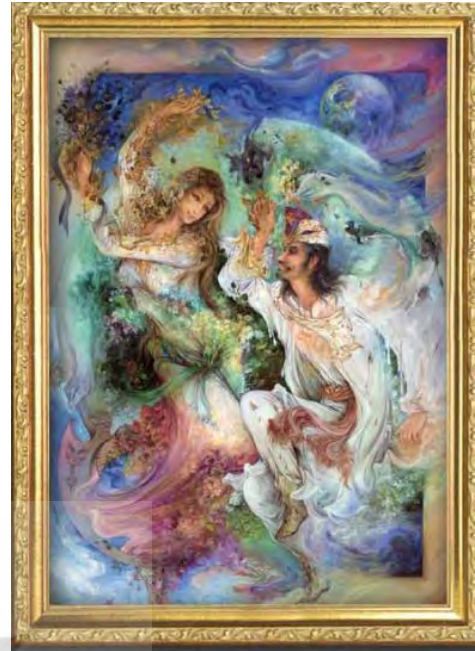
تصویر ۲: زن اثر استاد فرچیان (منبع: نگارنده).

تصویر شماره (۲) بر نگاه مولوی به زن به عنوان جلوه‌ای از زیبایی خداوند تطابق دارد.