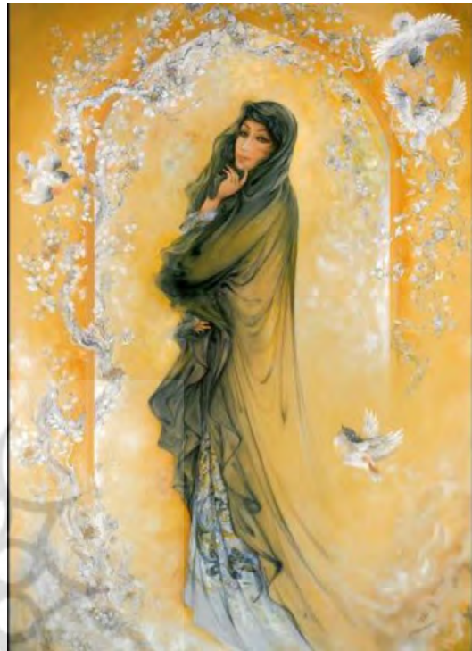
تصویر ۳: زن اثر استاد محمود فرشچیان. (منبع: نگارنده).

چون چندگهی نشست کدبانوی جان عشق تو رسید و سه طلاقش دادم (مولوی، ۱۳۸۷: ۸ / ۱۹۲). تصویر شماره (۳) بر برداشت مولونا از زن به عنوان جلوه‌ای از نور همخوانی دارد.