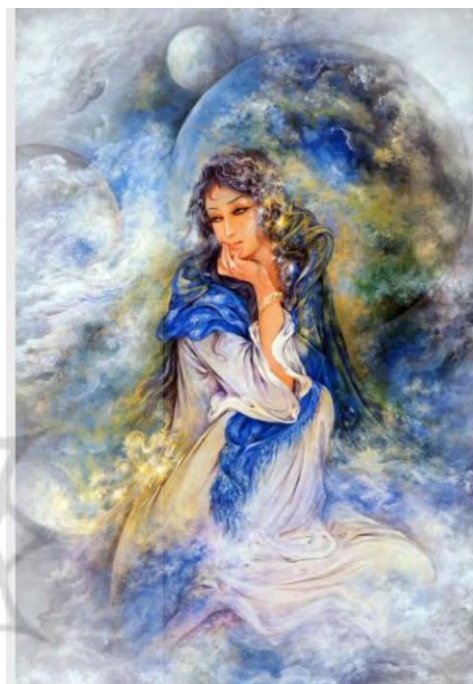
تصویر ۱: تصویر معشوق اثر استاد محمود فرشچیان.

زن علاوه بر اینکه نماد پست‌ترین جنبه‌های تمثیلی در عرفان هست، از جهتی دیگر با نمادهای الوهیت، ارتباط پیدا کرده و سمبل نور برتر می‌شود. چهره ظلمانی زن، در میان دیگر فرقه‌ها و مسلک‌ها نیز دیده می‌شود. آگوستین قدیس در وصف زن می‌نویسد: «حیوانی است که نه استوار است و نه ثابت قدم، بلکه کینه‌توز است و زیان‌کار و منبع همه مجادلات و نزاع‌ها و بی‌عدالتی‌ها و حق‌کشی‌ها» (نقل: ستاری، ۱۳۷۳: ۶۱). تصویر شماره (۱)، نگاره‌ای از زن است که نقاش او را نماد نور و روشنایی ترسیم کرده است.