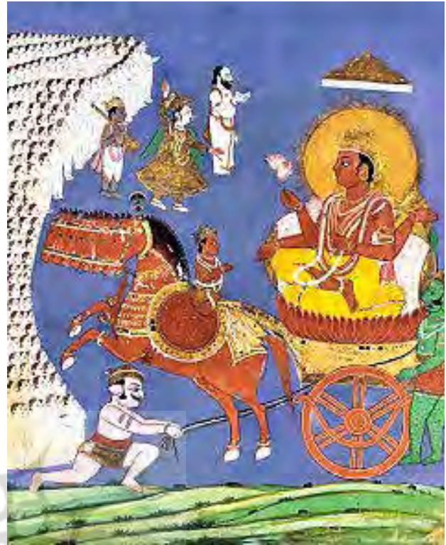
تصویر ۶. سوری یا سوار بر ارابه. مأخذ: http://www.harekrsna.de/surya/12adityas.htm

در هرم خدایان «زتک» خدای بزرگ خدای خورشید مظهر