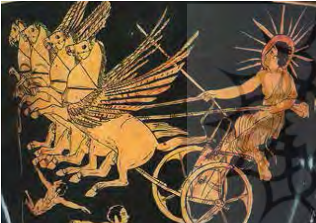
تصویر ۹. هلیوس سوار بر ارابه چهار اسبه.

عنصر خورشید با بسیاری از گل‌ها و حیوانات از جمله گل داوودی، لوتوس، آفتابگردان، عقاب، گوزن، شیر و ... همچنین با فلز طلا که در علم کیمیاگری خورشید فلزات است مقایسه شده است. در باور چینی خورشید یانگ - مذکر و در مقابل بین ماه و مؤنث است.