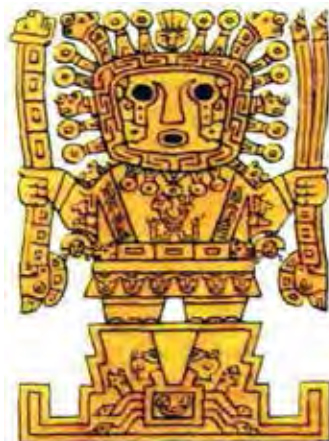
تصویر ۱۲.ب) ویراکوچا خدای خورشید اینکاها با آذرخش در دست و تاج خورشید بر سر و اشک‌های بارانی.