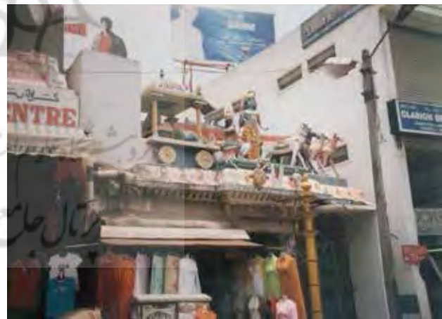
تصویر ۷. ورودی معبد در جنوب هند، میترا با ارابه ۴ اسب.

حمل می‌کند که نماد خورشید الهی است. خورشید نماد جهانی شاهنشاه و قلب مملکت است. مادر خاقان «وو» از سلسله هان خواب دید که خورشید وارد سینه‌اش شد و پسرش وو را به دنیا آورد. پس خورشید نماد باروری و شاهنشاهی است.