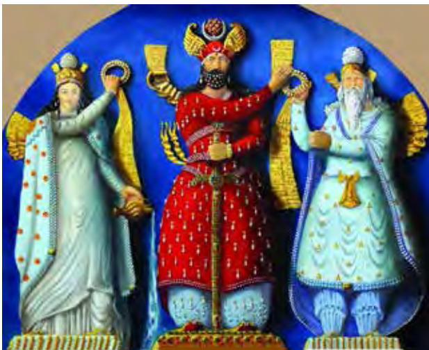
تصویر ۱۴. انتصاب اردشیر دوم به پادشاهی؛ از چپ به راست: میترا، شاپور دوم، اهورا مزدا. پایین: ژولیان امپراطور روم، طاق بستان. مأخذ: جوادی و آوزمانی، ۱۳۹۵، ۷۳.