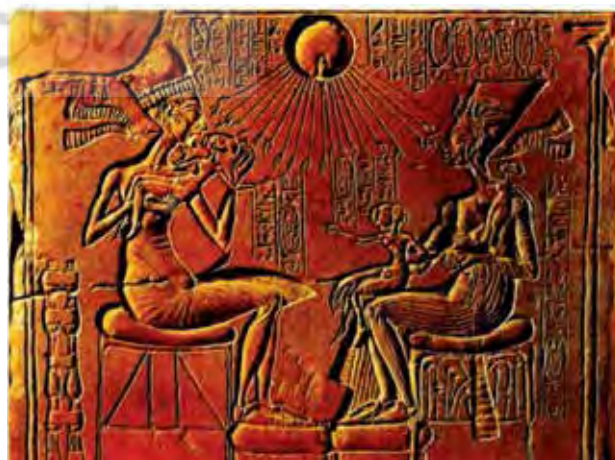
تصویر ۵. آمنحوتپ چهارم و خدای آتون با قرص خورشید.

«آپولون» خدای خورشید و قطب قله‌های عرفانی که از دودمان هیپربورها بود، پیکانی چون شعاع خورشید داشت (تصویر ۱۱). «هوخیوس» اهل باتوس می‌گوید: مسیح به مثابهٔ خورشیدی است که عدالت را پرتو می‌افکند یعنی همچون خورشید معنوی و قلب جهان. «فیلتوتئوس سینیایی» می‌گوید: مسیح خورشید حقیقت است. خاخام اعظم فرقه‌ای از یهودیان قرص زرین بر سینه خود