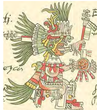
تصویر ۱۲.الف) خدای خورشید از تک-خورشید عقاب (یا مرغ مگس خوار) - اویتسیلوپوچتلی، طرحی در مستندات تلریانو-رمنسیس.

و غرب عالم شاهد هستیم. به نظر می‌رسد دلیل برتری مهر - میترا اسطوره خورشید آریایی، در ایران ایزد ایزدان، دارای تمامی صفات خیر و نماد نور و فروغ خورشید بوده است، از این رو با سایر خورشید خداه‌ها و خدایان پرستی دیگر اقوام متفاوت است. مهر ایرانی یار و یاور جنگجویان راستین است که از وطن دفاع می‌کند، خدای عهد و پیمان و مظهر نور ایزدی است.