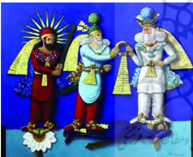
تصویر ۱۵. تاج‌گیری اردشیر دوم از اهورا مزدا با حضور میترا، طاق بستان.

از روستایی به روستای دیگر می‌روند تا باروری و حاصل‌خیزی زمین را در سال آینده تأمین کنند. در اروپا نیز مراسم چون غلطاندن چرخ‌های مشتعل به مناسبت انقلاب شمسی و مراسم مشابه دیگر همچون بازسازی جادویی قوای خورشیدی وجود دارد. مکزیکیان با قربانی کردن اسرا برای خورشید پایندگی را تأمین می‌کردند چون می‌پنداشتند که خودشان ضامن تجدید و نوشدن انرژی پایان‌یافته اختر روز خواهند شد. این قهرمانان خورشیدی را نزد شبانان آفریقایی، اقوام ترک، مغول و یهود شمشون (samson) و در میان ملل هند و اروپایی مشاهده می‌کنیم (همان، ۱۵۳)؛ (تصویر ۱۶).