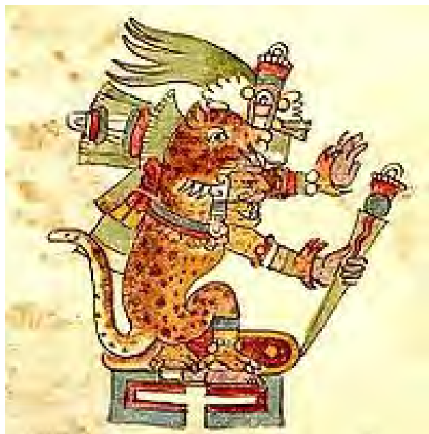
تصویر ۱. تزکاتلیپوکا خدای مکزیک در قالب پلنگ در ارتباط با مراسم شمنیک.

متون هندو، خورشید را مبدأ وجود همه چیز می‌داند، آغاز و انتهای هر آنچه ظاهر است و اطعام‌کننده همگان (همان، ۱۱۸). خورشید، (Sing-Bong) در رأس خدایان مونداهای بنگال جای دارد (الیاده، ۱۳۷۲، ۱۳۸). «سوریا» خدای خورشید هندی با چهره‌ای مردانه ظاهر شده و مرکب او ارابه‌ای با هفت اسب است که در مهرابه‌های جنوب هند دیده می‌شود. میترا خدای خورشید آریایی هند در قالب مردی است که با ارابه چهار اسبه به آسمان