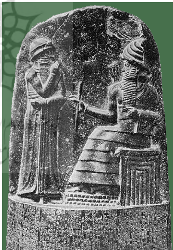
تصویر ۱۳. ایزد خورشید شمش، بین‌النهرین.

مهر پس از پایان رسالت خویش که آگاهی و تبلیغ دین خویش است سوار بر اریه چهار اسبه به آسمان می‌رود و روز واپسین برای شفاعت پیروان به این جهان باز می‌گردد. همان گونه که مسیح (ع) پس از شام آخر با یاران خویش، عروج کرد و روز قیامت جهت شفاعت یاران باز می‌گردد. در یونان و ایتالیا کیش مهر گاه با عرفان گنوسی شرقی آمیخته است.