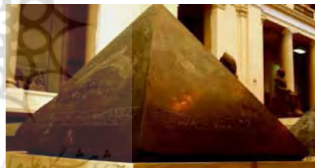
تصویر ۲. سنگ مقدس بن بن، نوک هرم فرعون در معبد ققنوس.

سنگ به شمار می‌رفتند (هارت، ۱۳۷۴)؛ (تصویر ۲). مصریان باستان بیش از هر مذهب دیگر کیش خورشیدپرستی داشتند. طغیان منظم رود نیل اهمیت اساسی در زندگی مردم داشته است. پرتو درخشنده آفتاب، حاصل‌خیزی لایه‌های رسوبی نیل، و بازگشت مداوم فصل‌های گرم، بادهای صحرا که با خود مرگ غلات را همراه می‌آورد، بر مصری‌ها تأثیر بسیار داشت. از این رو آنها خورشید را نیروی اصل طبیعت یا خدا می‌پنداشتند و آن را «رع» می‌نامیدند (گروه نویسندگان، ۱۳۹۹).