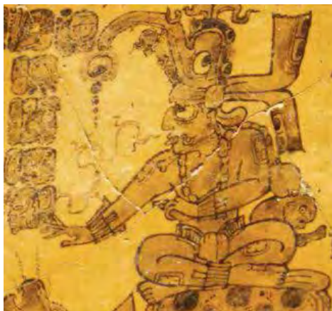
تصویر ۱۲.ج) کینیچ آهانو خدای خورشید در اساطیر قوم مایا.