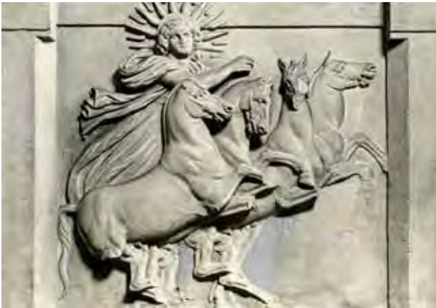
تصویر ۸. میترا سوار بر ارابه چهار اسبه.