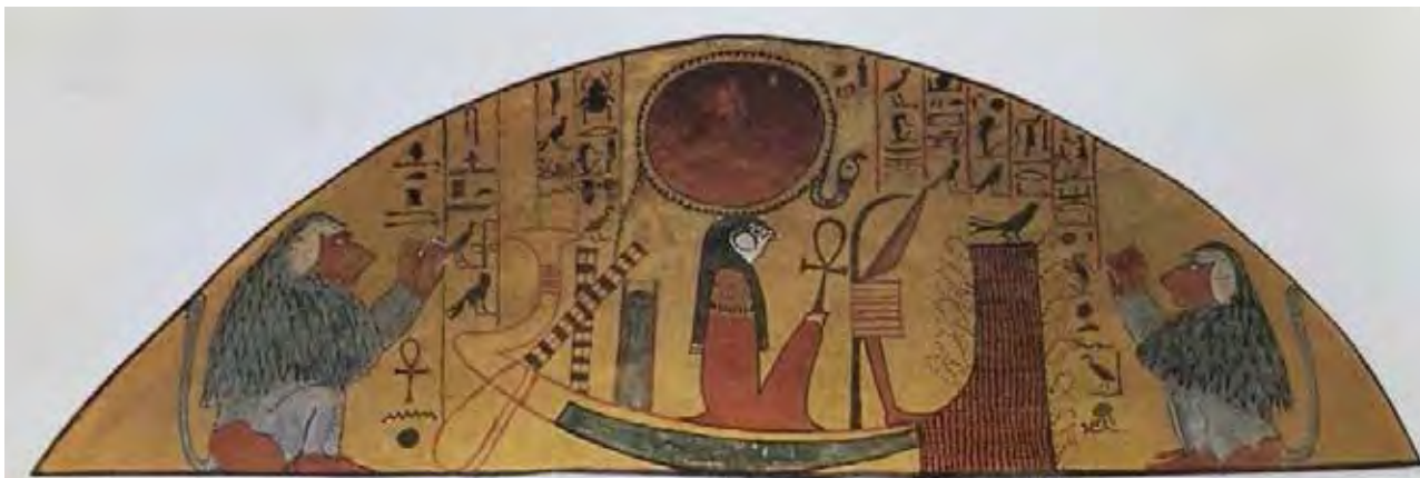
تصویر ۳. رع خدای خورشید در زورق با دو بوزینه- جشن طلوع خورشید.