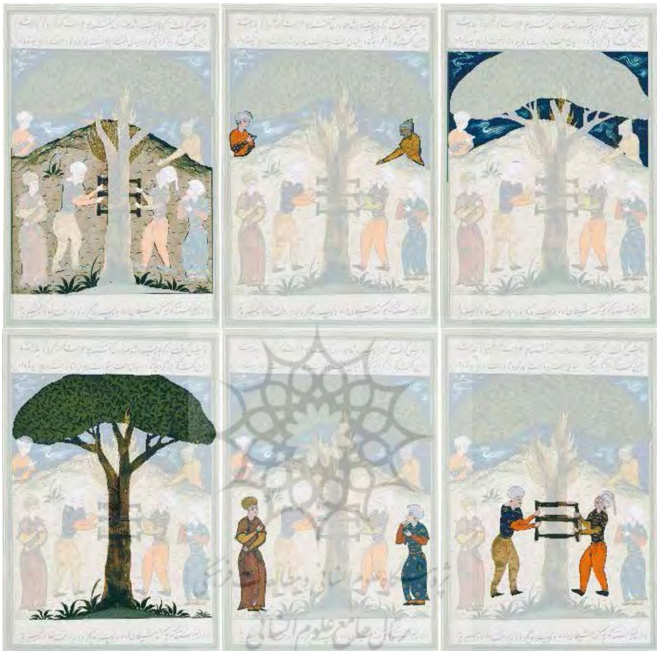
تصویر ۵. پلان بندی نگاره.

رنگ‌های درخشان، نورانی و بدون سایه تصویر کرده است. در این نگاره، رنگ زرین فام طلایی نوید پیروزی نور نیکی و انگار ازلی نور بر شر است. دیگر عناصر با رنگ‌های آبی لاجورد، زرد و نارنجی طراحی شده‌اند. چرخش رنگ‌ها در ترکیب بندی رنگی اثر کاملاً مشهود است. آبی بیانگر ایمان و نشانگر فضای نامتناهی و معرف روح است، اما هنگامی که تاریک می‌شود و به تیرگی می‌گراید، مفهوم ترس، وهم، اندوه و مرگ و نیستی به خود می‌گیرد (ایتن، ۱۳۸۴، ۲۱۸).