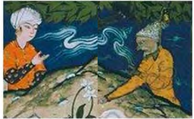
تصویر ۶. ابلیس و نقال.