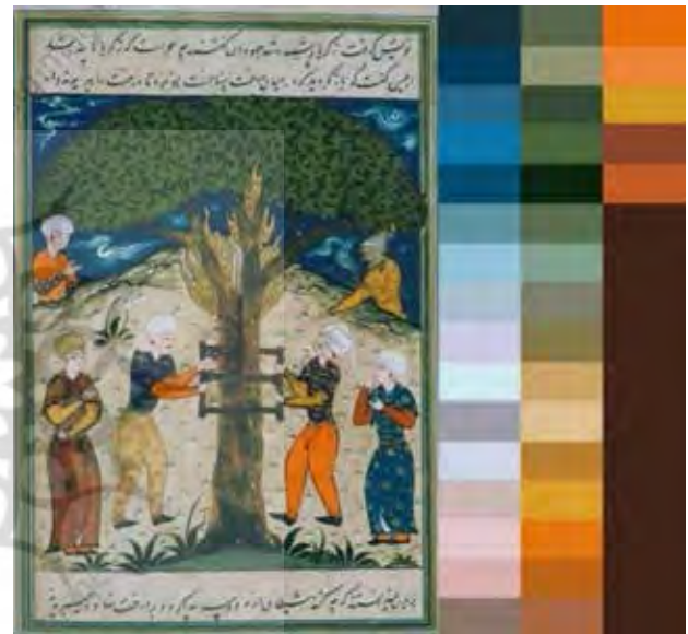
تصویر ۷. رنگ‌های به‌کاررفته در نگاره.

آستین‌بلند و ردایی بر روی آن تشکیل شده است. با این حال پوشش دو شخصیت اثر که درحال اراة درخت هستند از دیگر شخصیت‌ها متمایز است. آن دو لباس متداول آن دوره را به تن ندارند و بدون ردای بلند هستند که البته با چهرهٔ انسانی-حیوانی آنان نیز مطابقت دارد. فرم کلاه دوکی‌شکل ابلیس او را متمایز از دیگر شخصیت‌ها به‌تصویر کشیده است. از چهره‌نگاری نیم‌رخ، در چهرهٔ ابلیس، چهرهٔ ناظر سمت راست تصویر و یکی از دو شخصیت‌های ابلیس‌گونه با فرم تلفیقی انسان-حیوان استفاده شده است و از چهره‌نگاری سهرخ، در چهرهٔ راوی، چهرهٔ ناظر سمت چپ تصویر و یکی از دیگر شخصیت‌های ابلیس‌گونه با فرم تلفیقی انسان-حیوان استفاده شده است. چهره‌ها در این اثر هنری به فرم چهره‌های مغولان با چشمانی بادامی، بینی باریک و دهانی کوچک است و فاقد سایه‌پردازی و شخصیت‌سازی هستند. در نگارهٔ مورد بررسی، از چهره‌های بی‌حالت همراه با حرکات اغراق‌آمیز مرسوم در نقاشی سبک‌های