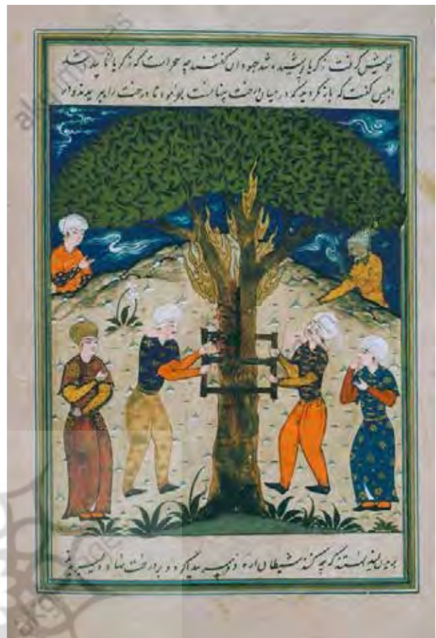
تصویر ۲. نگاره شهادت حضرت زکریا.

شکل مارپیچ در بنیان ترکیب‌بندی موجب حرکت و پویایی است و چشم بیننده را به سوی نقطه تمرکز اثر جذب و مجدد از آن دور می‌کند (مراثی، ۱۳۸۴، ۴۳).