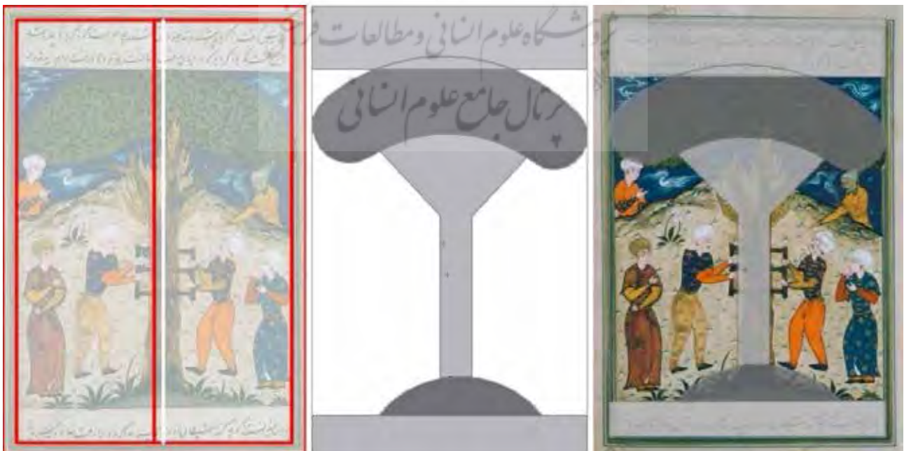
تصویر ۴. ساختار و محل قرارگیری عنصر اصلی نگاره.

همانطور که در تصویر ۴ مشاهده می‌شود، از آنجا که نقش درخت و پناه‌دادن درخت به زکریا سوژه اصلی نگاره است، نگارگر با قراردادن آن در مرکز کادر و انتخاب نوع قرارگیری در تأکید موضوع استمرار داشته است. فرم تنه درخت به شکل خط عمودی پهنه کادر را تقریباً به دو نیم تقسیم کرده است (در اصل خط قرمز رنگ وسط کادر است). نگارگر برای غلبه بر این بیان تصویری فرم چترگونه برگ‌ها را به فرم منحنی و نیم‌دایره اجرا کرده تا حرکت چشم را از خارج شدن کادر رهایی بخشد. او با قراردادن فرم‌های انسانی، که در قالب شخصیت‌های متفاوت و گاه به همراه صورتک‌های حیوانی، نمادی از ابلیس درون هستند، به شکل قرینه در دو طرف درخت