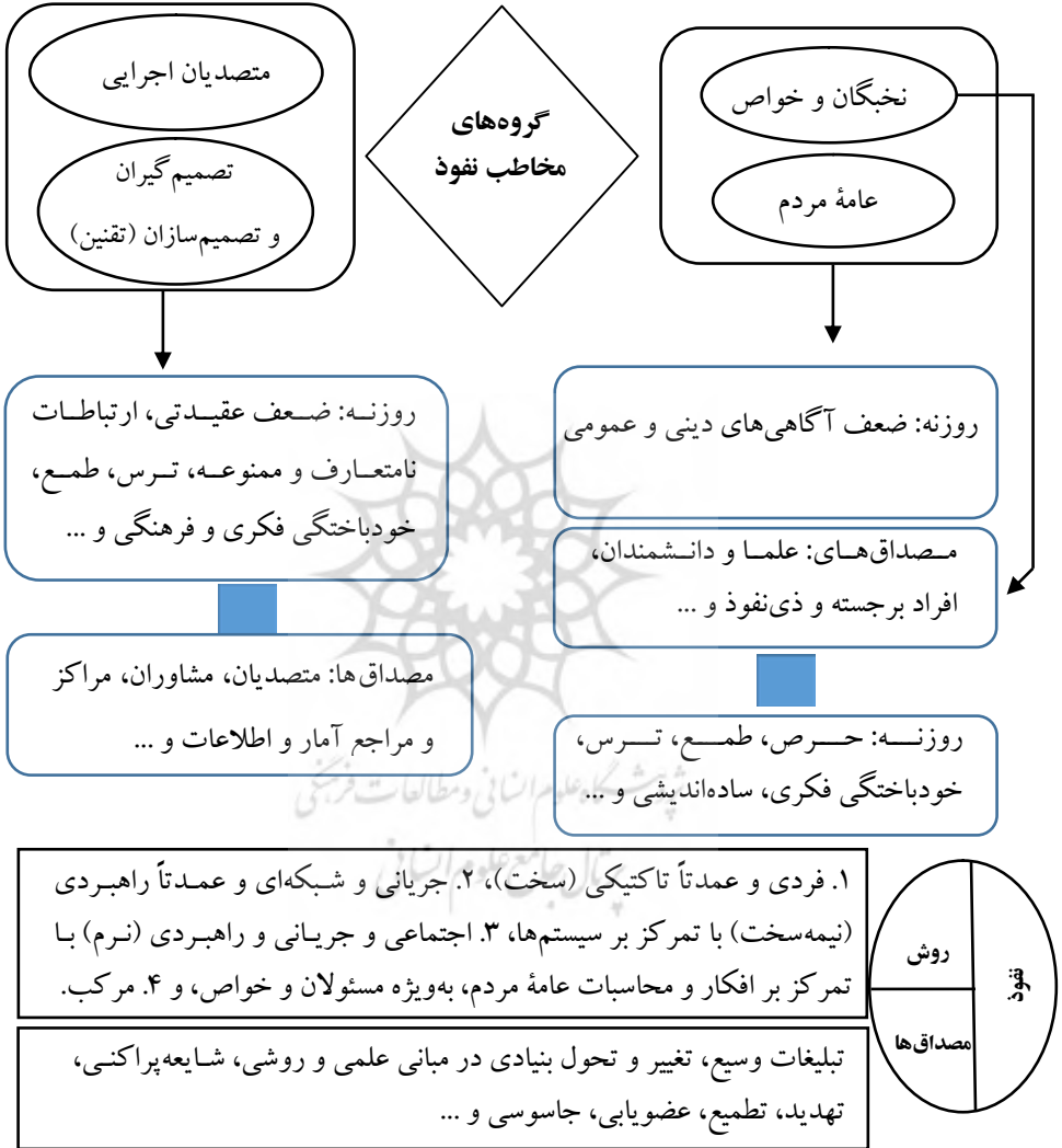
نمودار شماره ۱: گروه‌های مخاطب

به‌طور کلی، براساس آموزه‌های دینی و تجربی و مبتنی بر فرمایش‌های مقام معظم رهبری علیه‌السلام در سال‌های مختلف، هندسه نفوذ را می‌توان در نمودارهای زیر ترسیم کرد: