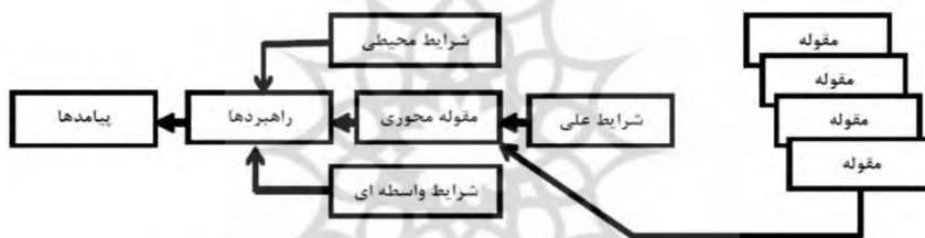
نمودار (۱): الگوی پارادایم در کدگذاری محوری (استراوس و کوربین، ۱۳۸۵)

یک) شرایط علی، مقوله‌هایی است مربوط به شرایطی که بر مقوله محوری تأثیر می‌گذارند. دو) مقوله محوری مقوله‌ای اصلی که می‌توان دیگر مقوله‌ها را به آن ربط داده و مکرر در داده‌ها ظاهر می‌شود. این مرحله، نظریه‌پرداز داده بنیاد، یک مقوله را در مرحله کدگذاری باز به عنوان «پدیده مرکزی» انتخاب کرده و آن را در مرکز فرایندی بررسی خود قرار داده و سپس، دیگر مقوله‌ها را به آن ربط می‌دهد. سه) راهبردها، کنش‌ها و برهم کنش‌های خاصی که از پدیده محوری نتیجه‌گیری می‌شود. چهار) زمینه شرایط خاصی که بر راهبردها تأثیر می‌گذارند. پنج) شرایط مداخله‌گر، شرایط زمینه‌ای عمومی که بر راهبردها تأثیر می‌گذارند. شش) پیامدها، خروجی‌های حاصل از به کارگیری راهبردها است (شماعی کوپائی و اسمعیلی گیوی، ۱۳۹۳: ۱۲۷).