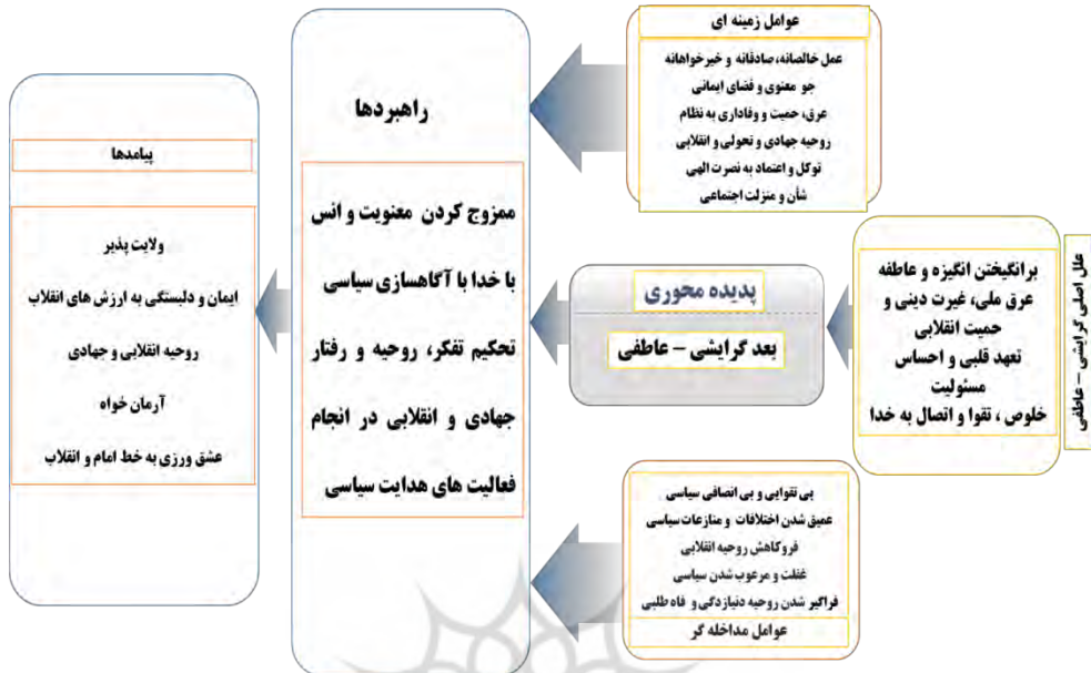
نمودار ۳. الگوی هدایت سیاسی بر پایه گرایشی - عاطفی