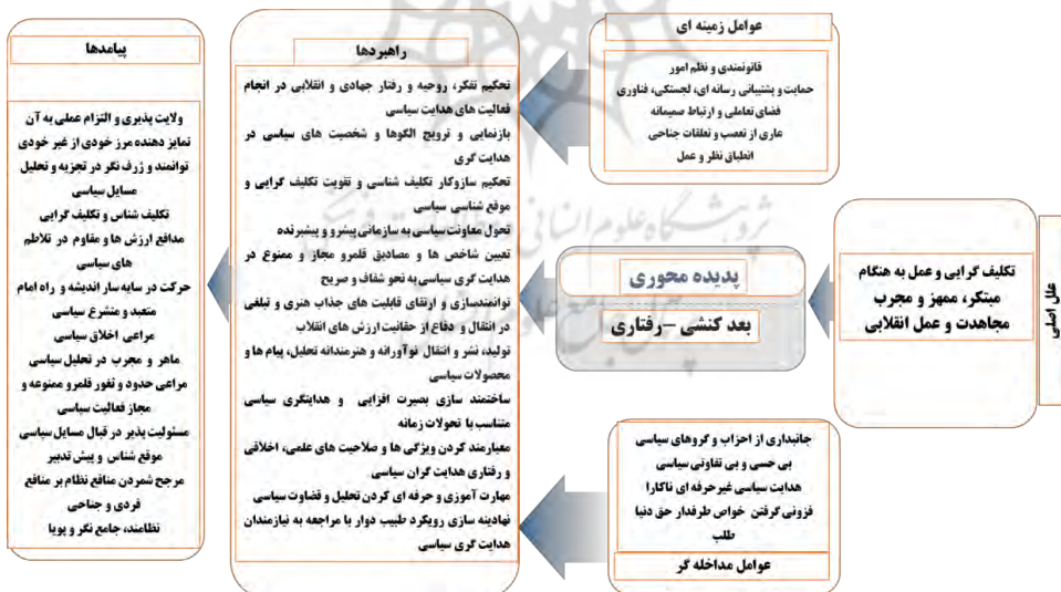
نمودار ۴. الگوی هدایت سیاسی بر پایه پدیده محوری کنشی - رفتاری