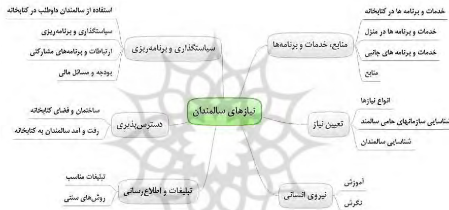
نمودار ۲. انواع خدمات و انتظارات سالمندان از کتابخانه‌های عمومی

مشارکتی»، به ترتیب با بیشترین فراوانی، و سپس «وجود برنامه، طرح و سیاست مشخص در زمینه ارائه خدمات به سالمندان»، «سیاست توسعه مجموعه و مجموعه‌سازی برای سالمندان» و وجود بودجه اختصاصی برای خدمات و مجموعه مورد نیاز سالمندان» اشاره کرد (جدول ۶). به‌طور کلی، مدل مفهومی به‌دست‌آمده از تحلیل یافته‌های حاصل از مصاحبه نیمه‌ساخت یافته با کتابداران و سالمندان در خصوص نیازها و انتظارات سالمندان از کتابخانه‌های عمومی در شش مقوله مذکور در نمودار ۲ نشان داده شده است.