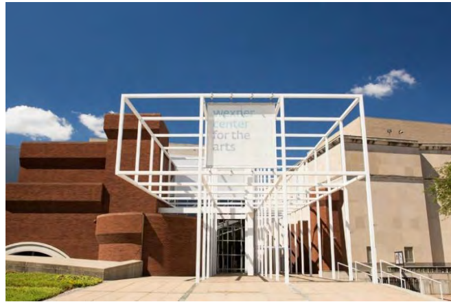
شکل ۱- مرکز وکسندر برای هنرهای بصری - اثر پیتر آیزنمن (www.sabatarch.com)

پیتر آیزنمن در پروژه ی مسابقه ی خانه ی مجازی (۱۹۹۷) در مورد جریان دو سیستمی اینگونه تعریف می کند: «سیستم یک عبارت است از طراح معمار و سیستم دو عبارت است از کامپیوتر». او اجازه می دهد هر دو سیستم آزادانه جلو بروند و در نهایت از ترکیب این دو سیستم یک پروژه ی معماری حاصل می شود. جالب اینکه فضایی که از این روش به دست می آید با ذهن انسان قابل تصور نیست.