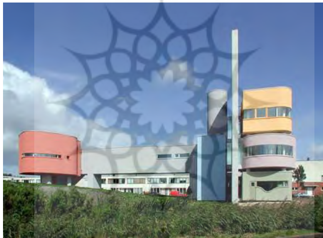
شکل ۲- خانه دیوار، جان هیداک (www.etoood.com)

آپارتمان های لیک شور (۱۹۴۸-۱۹۵۱) میس وندررو را می توان به عنوان یکی از اولین نمونه های استفاده از استراتژی دوسیستمی نام برد. پروژه از دیواری عظیم ساخته شده است و دیگر فضاهای پروژه در دو طرف آن آرایش پیدا کرده اند. فضاهای اصلی در یک طرف و فضاهای مربوط به ورودی، سرویس ها و سیرکولاسیون در طرف دیگر آن. هر وجه دیوار دارای ویژگی مستقل و در نتیجه فضایی خاص است (تصویر ۲).