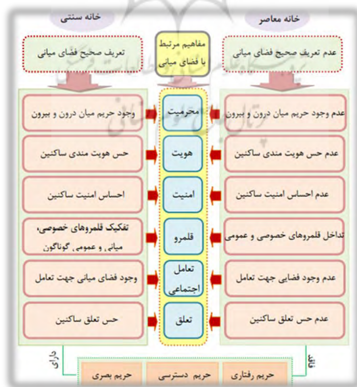
شکل ۵- مقایسه ی نقش فضای میانی در مسکن سنتی و معاصر