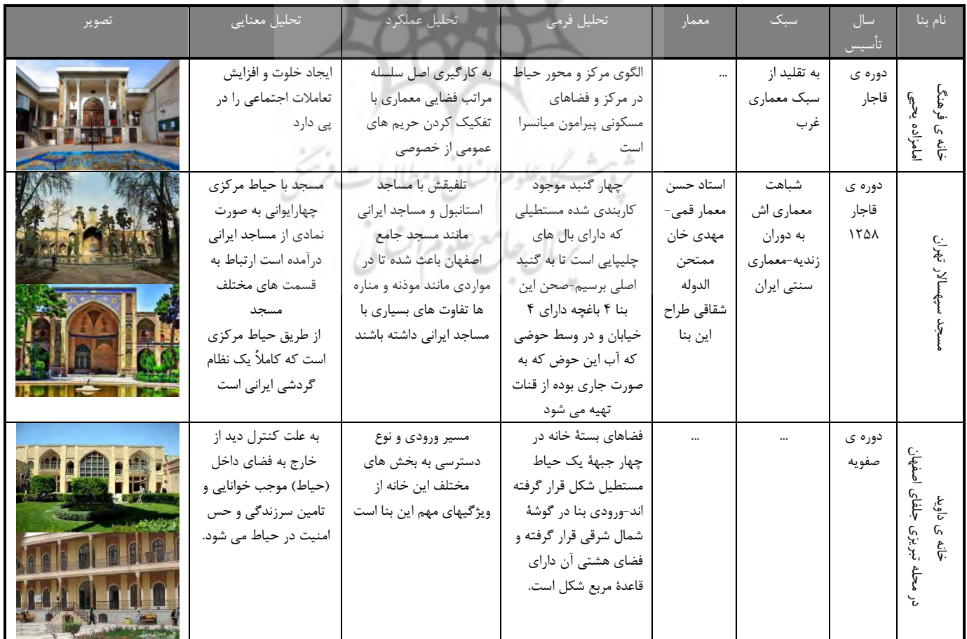
جدول ۲- تحلیل بناهای قبل دوران معاصر ایران از نظر فضاهای بینابین