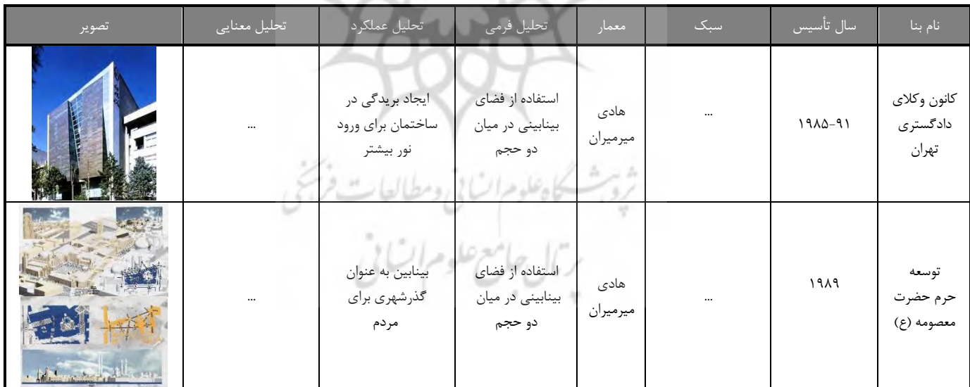
جدول ۳- تحلیل بناهای قبل دوران معاصر ایران از نظر فضاهای بینابین

در تحلیل جدول های فوق برای رسیدن خلق فضای بینابین، معماران از سه روش فرمی، عملکردی و معنایی استفاده کرده اند. در تحلیل فرمی مواردی همچون استفاده از دو حجم متضاد از نظر رنگ و حجم، تقسیم یک حجم به دو قسمت و ... مورد استفاده قرار می گیرد که شامل موارد ذیل می باشد: