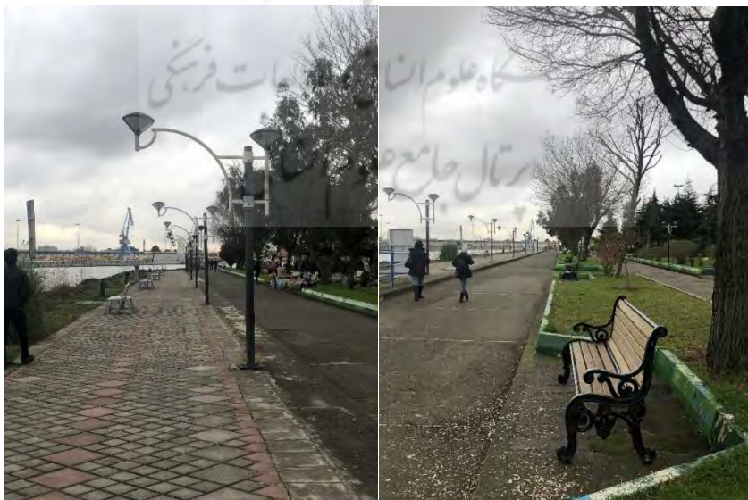
شکل ۳- کیفیت و چیدمان مبلمان فضایی بلوار بندرانزلی

مشاهده غیر مستقیم: جهت ارزیابی چیدمان مبلمان فضای شهری محدوده ی مورد نظر با توجه به مولفه های سرزندگی، پرسشنامه ای تهیه و در میان شهروندان توزیع گردید. میزان تاثیرگذاری مبلمان شهری و مولفه های سرزندگی در قالب سولاتی آنالیز شده مورد پرسش قرار گرفت. بنابراین از بین ۱۰۴ نفر به عنوان جامعه نمونه انتخاب گردید.