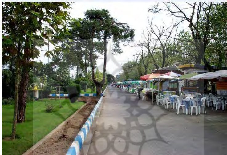
شکل ۲- کافه های حاشیه بلوار بندرانزلی

مشاهده مستقیم: استقبال شهروندان از بلوار بندرانزلی بسیار زیاد است، به خصوص در روزهای آخر هفته، حضور آن ها به اوج خود می رسد. به دلیل تنوع فضای سبز و وجود دریا و دید و منظر به فعالیت های بندری، این بلوار در اکثر ساعات روز و در روزهای مختلف سال مملو از جمعیت است. فعالیت ها در این بلوار معمولاً به چند صورت انجام می شود: نشستن و ایستادن مقابل دریا، نشستن و ایستادن به منظور صحبت و استراحت، حضور در کافه های حاشیه بلوار.