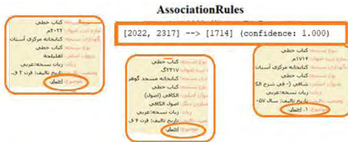
شکل ۴. نمایی از قوانین ایجاد شده و مطابقت آن با موضوع اخبار

در این قسمت می‌توان به نتایجی که از تطبیق میان شماره‌های ثبت در قوانین ایجاد با موضوعات منابع (نسخ خطی) به وجود آمده است چنین تفسیر نمود: