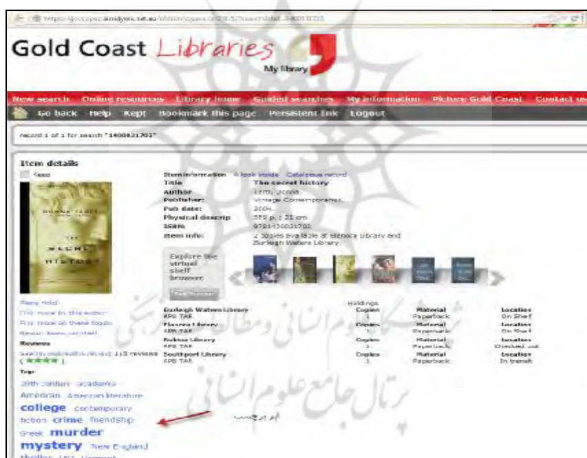
تصویر ۳: نمایش ابر برچسب با تمایز در اندازه در یک اپک کتابخانه (برگرفته از وب سایت کتابخانه گلدکوست)

193). مهم‌ترین مرکز ارائه خدمات برچسب‌دهی به کتابخانه‌ها، library Thing است که این قابلیت را به شکل یک ویژگی سفارشی به اپک‌های کتابخانه‌ای اضافه می‌کند. بر این اساس، یک قابلیت جستجوی جدید بر مبنای برچسب‌های داده شده به منابع به اپک‌ها اضافه می‌شود که به غنای بیش‌تر فهرست‌ها کمک می‌کند. بر اساس آخرین آمار موجود، بیش از ۴۰۰ کتابخانه در سراسر دنیا از خدمات برچسب‌گذاری در اپک‌های خود استفاده می‌کنند (Library Thing, 2012). نمونه‌هایی از اپک‌های کتابخانه‌ای که از قابلیت برچسب‌گذاری استفاده می‌کنند و تفاوت نحوه نمایش برچسب‌ها در آنها در تصاویر ۳ و ۴ قابل مشاهده است.