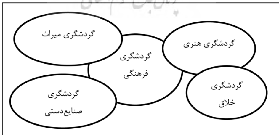
تصویر شماره ۱: جابه‌جایی گردشگری فرهنگی به گردشگری خلاق (Wurzburger et al, 2010)

اگرچه گردشگران نقش‌های فعالی در خلق تجارب خود در حین تعطیلات ایفا می‌کنند، فعالان این صنعت همچنان در طراحی و عرضه این فعالیت‌ها پیشگام هستند (Raymond, 2009). این گردشگران خلاق ذی‌نفعان اصلی گردشگری خلاق هستند. این امر در رابطه با گردشگران معمولی و نه فقط برای هنرمندان به عنوان گردشگران خلاق است (Tan et al, 2013). گردشگر خلاق، شخصی است که تجربه خود را به صورت فعالانه و فردی خلق می‌کند. گردشگران خلاق را می‌توان به دسته‌های مختلف تقسیم کرد؛ به عنوان مثال شبکه گردشگری خلاق، هنرمندان را به عنوان گردشگران خلاق می‌داند (Creative Tourism Network, 2013) و ریموند تمام گردشگران معمولی را که به یادگیری فرهنگ بومی