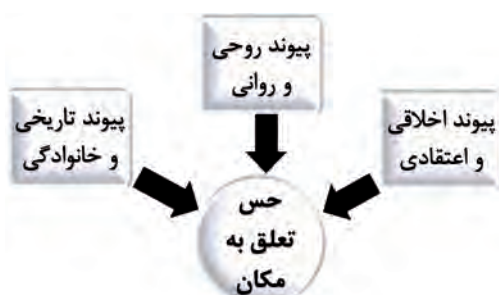
تصویر شماره ۱: مؤلفه‌های به وجودآورنده حس مکان (Pirbabaei & Sajadzadeh, 2011)

فردی و از طرف دیگر ریشه در تعاملات اجتماعی و ارتباط فرد و دیگران در محیط دارد (Ahmadi et al., 2014: 73).