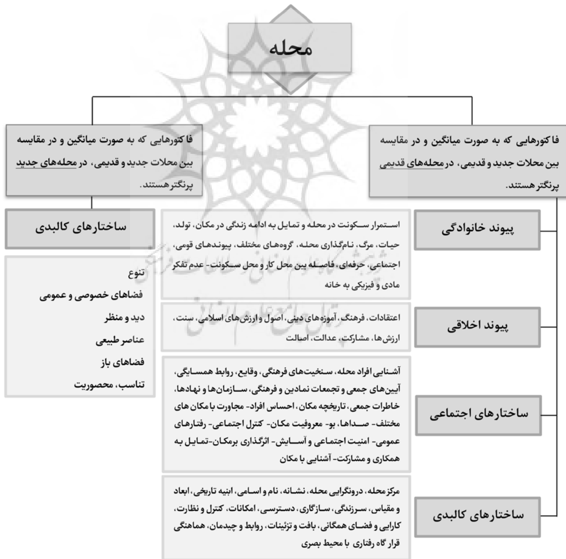
نمودار شماره ۳: نتیجه‌گیری حاصل از قیاس میانگین فاکتورها در محلات قدیمی و جدید

با استناد به نتایج آماری و نمودار شماره ۳ درباره ماهیت دو بعد کالبدی و اجتماعی تعلق مکانی در محلات قدیم و جدید می‌توان گفت که در محلات قدیمی عوامل اجتماعی مانند آشنایی افراد محله، سنخیت‌های فرهنگی، اعتماد و روابط همسایگی، خاطرات جمعی، تاریخچه مکان، کنترل اجتماعی، امنیت اجتماعی و سایر متغیرهای اجتماعی نسبت به عوامل کالبدی و ساختار در حال تغییر محله‌ها، عامل قوی‌تر و اثرگذارتری بر سطح رضایت‌مندی و حس تعلق در ساکنان محله است. از طرفی متغیرهای اجتماعی