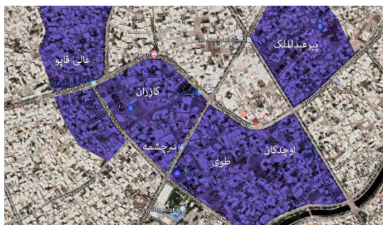
■ محلات قدیمی شهر اردبیل

مطابق با نتایج حاصل از مصاحبه با افراد و نتایج میانگین رضایت‌مندی از فاکتورها در جدول‌های شماره ۳ و ۴، مشخص شد که شمار بیشتری از افراد ساکن در محلات قدیمی نسبت به ساکنان محلات جدید، با محل زندگی خود دارای پیوند تاریخی و خانوادگی هستند. در مقایسه با محلات جدید، در محلات قدیمی (به دلیل قدمت آنها) معمولاً ساکنان از بدو تولد در آنجا زندگی می‌کنند و پدران و فرزندان آنها نیز از ساکنان همان محلات بوده‌اند. به همین دلیل ساکنان محلات قدیمی با یکدیگر و با محله خود آشنایی و پیوندی عمیق دارند و حتی نام‌گذاری‌های مکان‌های مختلف محله نیز براساس نام‌ها و