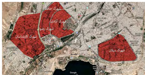
■ محلات جدید شهر اردبیل