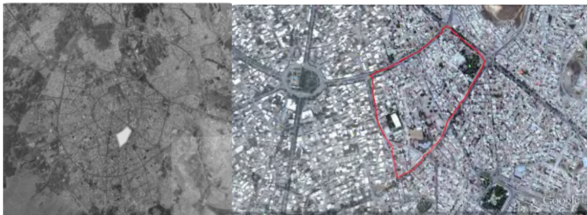
تصویر شماره ۱: موقعیت قرارگیری محله برج قربان در عکس هوایی همدان (Mapping Organization of Hamedan Province, 2015)

مطالعه موردی محله برج قربان در جنوب شرقی (متماثل به مرکز) و رینگ دوم شهر همدان، دارای مساحتی حدود ۲۵۰ هزار مترمربع و جمعیت چهار هزار و ۱۰۰ نفر است که به دلیل قرارگیری بنای گردشگری برج قربان در محله، به این نام شهرت دارد. تصویر شماره ۱ موقعیت نمونه مطالعه را نشان می‌دهد.