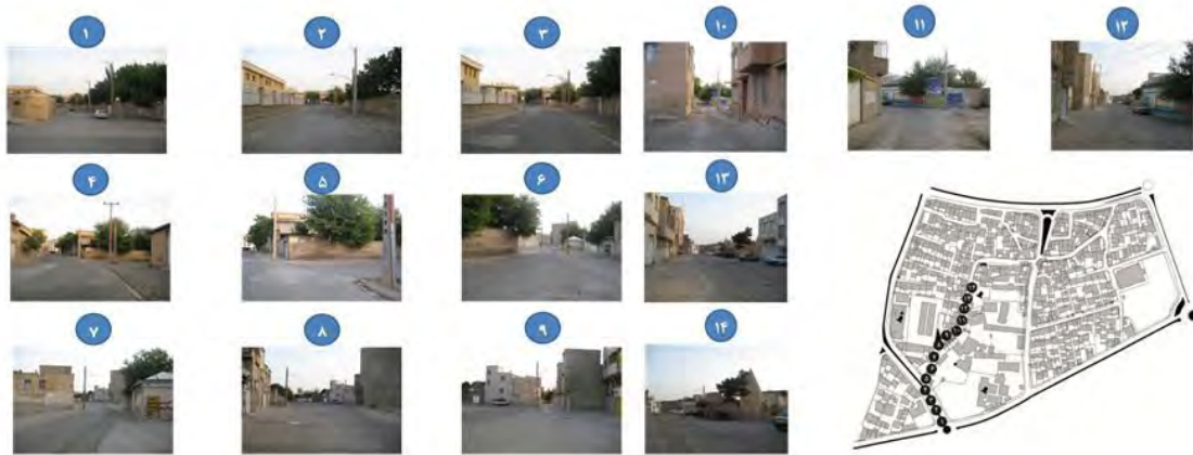
تصویر شماره ۲: نمونه‌ای از دید پی‌درپی و اینجا و آنجا در محله برج قربان