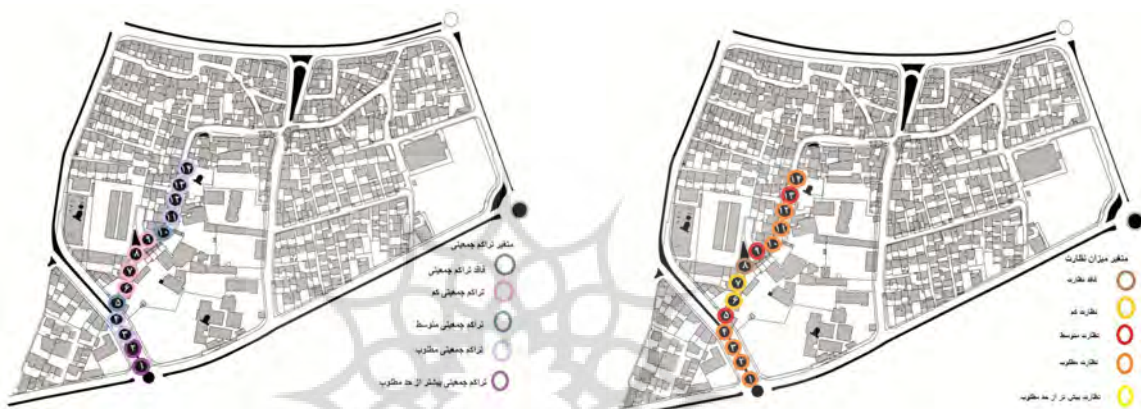
تصویر شماره ۳: متغیر میزان نظارت