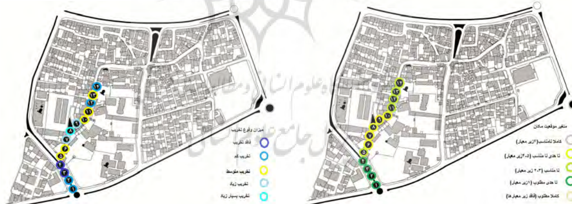
تصویر شماره ۵: متغیر مکان