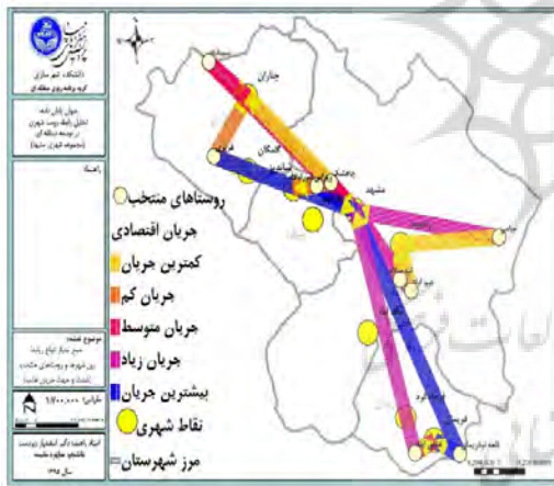
تصویر شماره ۲: جمع‌بندی روابط اقتصادی

در بعد جریان تولیدی، اغلب فروش محصولات به سمت بازار مشهد است، حتی روستاهایی مانند عشق‌آباد که در نزدیکی فریمان هستند، محصولات کشاورزی خود را به مشهد می‌برند. زیرا معتقدند در مشهد محصولات با قیمت بیشتر و سریع‌تر به فروش می‌رسد، مشتری بیشتری دارد و پول نقد به کشاورزان داده می‌شود.