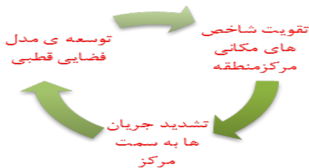
تصویر شماره ۵: رابطه بین شاخص‌های جریان محور و مکان محور و نوع توسعه در منطقه مورد بررسی

از مقایسه جدول شماره ۹ با جدول شماره ۳ (سطح‌بندی شهرهای مجموعه شهری مشهد) و جدول شماره ۵ (جایگاه مکانی روستاهای هدف مطالعه) چنین به دست می‌آید که بین رابطه روستاها و شهرها و میزان بهره‌مندی ایشان از شاخص‌های مکانی، رابطه‌ای مستقیم است. بدین صورت که هرچه این شاخص‌ها، خصوصاً مرکزیت در عملکرد و جمعیت، در سطح بالاتری باشد و شهر در سطح فضایی بالاتر قرار گیرد، میزان مراجعه به آن به وسیله دیگر سکونتگاه‌ها بیشتر می‌شود. هرچه مراجعه بیشتر شود، مرکزیت آن تقویت می‌شود. از آنجا که بین شهر مشهد و سایر شهرها از نظر شاخص‌های مکانی، سلسله‌مراتبی وجود ندارد، در بعد جریان نیز، روابط حداکثری بدون رعایت سلسله‌مراتبی به سمت این شهر صورت گرفته است. این جریان‌ها به صورتی است که عمدتاً نیروی کار سایر شهرها و روستاها، ارزش افزوده محصولات کشاورزی و افزایش ارزش افزوده در بخش خدمات را به شهر مشهد اختصاص می‌دهد. هرچند سکونتگاه‌های پیرامونی، در ارتباطشان با شهر مشهد، سود بیشتری را عاید آنها می‌کنند، ولی رشد آنها در مقابل رشد چند برابری مشهد، شکاف بیشتری بین توسعه این سکونتگاه‌ها و شهر مشهد فراهم آورده است. بر این اساس می‌توان گفت نوعی روابط غالباً یک‌جانبه بین مشهد و سایر سکونتگاه‌ها وجود دارد که نمایانگر ساختار فضایی قطبی و تک‌مرکزی از این منطقه است. تصویر ۵ این مفهوم را به صورت خلاصه نشان داده است.