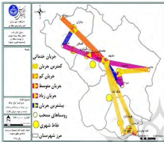
تصویر شماره ۳: جمع بندی روابط خدماتی

اصلی یا از طریق راه اصلی یا روستایی به این مسیرها متصل هستند. در این میان روستای تپه سلام و جیم آباد، چاهشک، سیدآباد و قلعه نوفریمان در مسیر آزاد راه بوده و سایر روستاها به راه های روستایی دسترسی نزدیک تری دارند. همچنین از نظر خدمات حمل و نقل عمومی، روستای تپه سلام و جیم آباد با برخورداری از خط راه آهن در مسیر خود بیشترین امتیاز و پس از آن نورآباد با بهره مندی از خط اتوبوس شرکت واحد بیشترین امتیاز را داراست. تلفیق امتیاز تمام زیرشاخص های جریان خدماتی در تصویر شماره ۳ ارائه شده است.