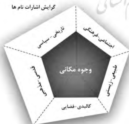
تصویر شماره ۴: مدل تحلیلی پژوهش؛ نام مکان‌ها و بازنمای شخصیت شهر اردبیل

- کوچه سید احمد: سید احمد، عالم و مجتهدی بود و در مسجدی که به نام او اکنون در اردبیل باقی است، به تبلیغ اسلام و تبیین احکام دین می‌پرداخته و مجالس وعظ او به منزله کلاس درسی برای همه طبقات به شمار می‌آمده است (Safari, 1971, Vol, 3: 300). با این‌که دیدیم در برخی موارد تحلیل از نام‌های مکان‌ها حتی از روند شکل‌گیری مکان تا ویژگی شکل و فیزیک شهر و روح آن را حکایت می‌کند، اما دسته‌بندی نام‌ها در قالب کلان مشخصه‌ها و مؤلفه‌های مکانی نشان می‌دهد که اشارات سمبلیک نام‌ها در شهر اردبیل نه صرفاً در توجه به کمیت نام‌ها بلکه با نگاه به کیفیت، درجه اهمیت، تأثیرگذاری آنها و انتقال کلان روایت‌های موجود در پس پیام آنها، میل بیشتر و نیرومندی به بازنمای شخصیت قدسی- مذهبی شهر در عین همراهی سایر مشخصه‌ها دارد (تصویر شماره ۴).