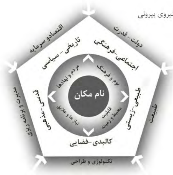
تصویر شماره ۲: مدل چارچوب مفهومی؛ نام مکان برآیند فرآیندهای مختلف و بازنمای مشخصه مکان