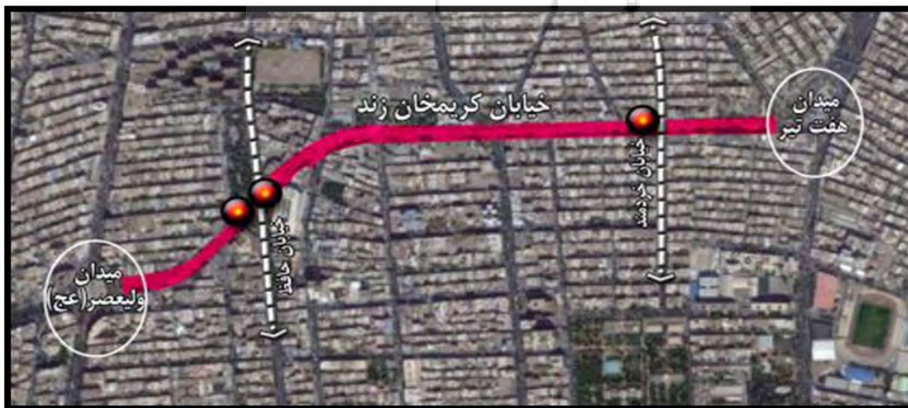
تصویر شماره ۱: موقعیت قرارگیری نمونه مورد مطالعه

نمونه مورد مطالعه این پژوهش، خیابان کریمخان زند تهران واقع در منطقه ۶ شهرداری انتخاب شده است. این منطقه به دلیل استقرار در مرکزیت جغرافیایی شهر تهران به عنوان استخوان بندی شهر تهران و مرکز نقل جدید حکومتی، اداری و تجاری ایفای نقش می‌کند (Naghsh-e-Jahan Pars Co., 2007). خیابان کریمخان زند محور پیونددهنده دو مرکز هسته‌ای کار و فعالیت یعنی میدان هفت‌تیرو میدان ولیعصر در جهت شرقی-غربی است که با وجود کاربری‌های اداری-خدماتی در سطح فرامنطقه‌ای، تردد بالایی پیاده و سواره در آن به وقوع می‌پیوندد اما مدت‌هاست که اولویت حرکت در اختیار وسایل نقلیه قرار گرفته و سبب گرایش به راه‌حل