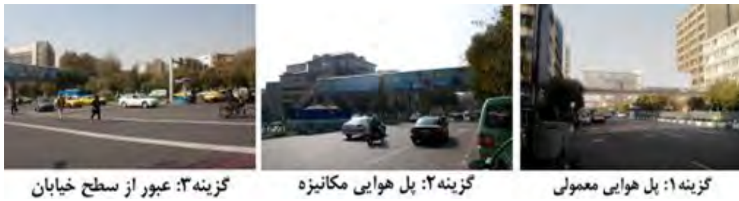
گزینه ۱: پل هوایی معمولی گزینه ۲: پل هوایی مکانیزه گزینه ۳: عبور از سطح خیابان

تصویر ۲ موقعیت سه گزینه مورد نظر سنجش را در کنار یکدیگر نشان می‌دهد.