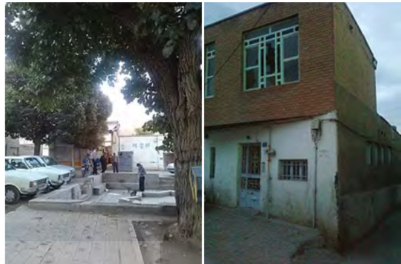
تصویر ۴: پنجره‌های شکسته و فضاهایی با اختلاف سطح در مرکز محله

پس از مشاهدات میدانی که در مرکز محله آخوند انجام شد، نکاتی در مورد راهبردهای رویکرد CPTED مورد مذاقه قرار گرفت. با توجه به راهبردهای نظارت طبیعی رویکرد CPTED، موارد زیر مشاهده گردید (تصویر شماره ۴).