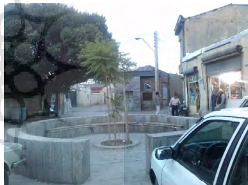
تصویر ۵: دسترسی‌های نامناسب منتهی به مرکز محله و تبدیل آن به پارکینگ