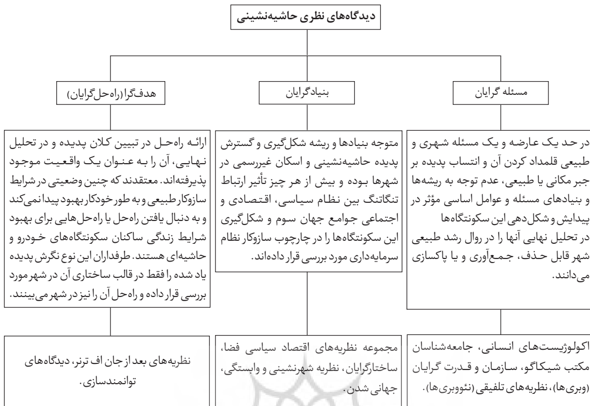
تصویر ۱: دیدگاه‌های نظری حاشیه‌نشینی - (Sheikhi, 2002: 37-38)

حجم نمونه برای جامعه آماری از طریق رابطه کوکران مطابق زیر می‌باشد: