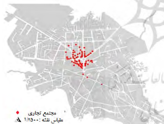
نقشه ۲: موقعیت مجتمع‌های تجاری شهر بانه در سال ۱۳۹۳

برای تدقیق محدوده مرکزی شهر بانه از مشاهدات میدانی و برداشت وضع موجود و همچنین برای تدقیق محدوده تجارت غیررسمی شهر بانه از نظرات کارشناسان و مسئولان شهری استفاده گردیده است. یکی از مهم‌ترین بارزهای اشتغال غیررسمی رشد قارچ‌گونه مجتمع‌های تجاری در شهر بانه می‌باشد؛ به طوری که در ۱۵ سال گذشته تعداد این مجتمع‌های تجاری از یک عدد به ۸۵ عدد در سال ۱۳۹۳ رسیده است. از آنجا که کالاهایی که در این مجتمع‌های تجاری به فروش می‌روند، عمدتاً از طریق قاچاق کالا وارد می‌شوند و بیشتر مجتمع‌های تجاری فاقد پروانه احداث هستند و از آنها مالیات نیز دریافت نمی‌گردد و شاغلان در این بخش فاقد بیمه اجتماعی هستند، بر طبق شاخص‌های مستخرج از مبانی تحقیق می‌توانند در دسته فعالیت‌های غیررسمی جا بگیرند. در اکثر تحقیقات انجام شده در این زمینه از مجتمع‌های تجاری شهر بانه به عنوان مراکز تجارت غیررسمی اشاره شده است. همان‌طور که در نقشه ۲ نیز مشهود است، تمرکز این مجتمع‌های تجاری در محدوده کوچکی از مرکز شهر بانه می‌باشد.