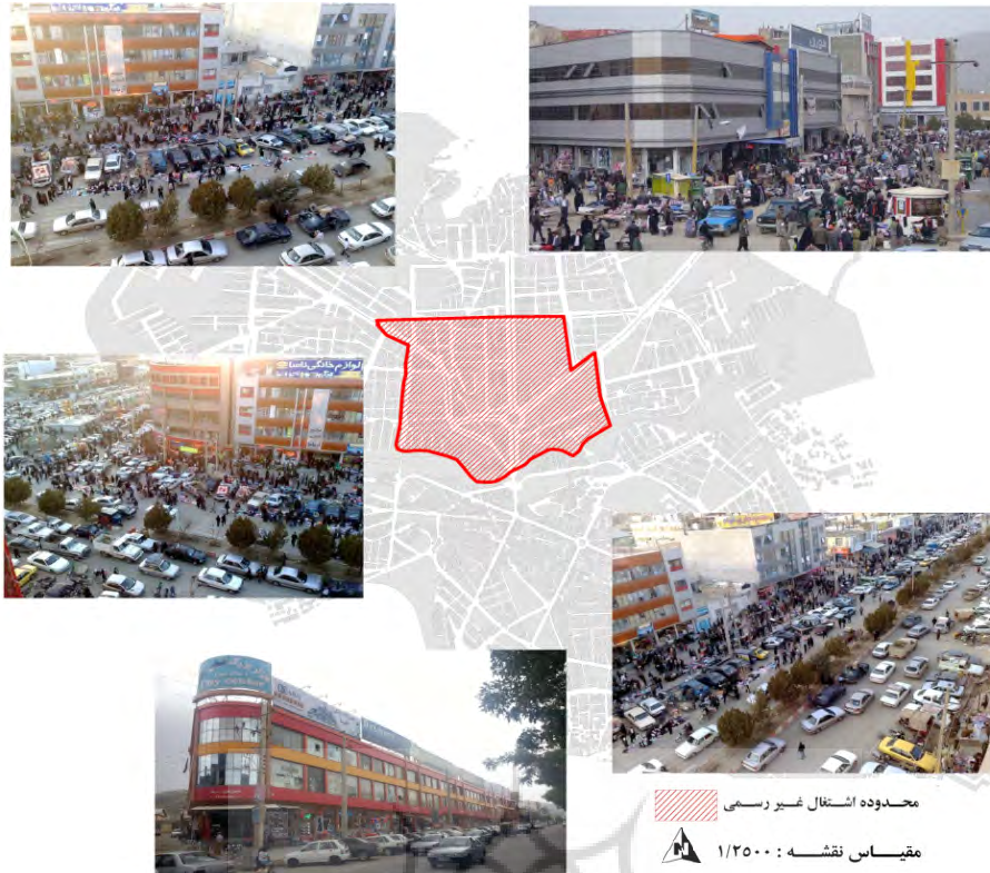
نقشه ۴: تعیین و تدقیق محدوده تمرکز اشتغال غیررسمی

هکتار کاهش یافته است. از طرفی سهم کاربری های مسکونی - تجاری از ۱,۰۲۰۷ هکتار در سال ۱۳۹۳ به ۴,۵۳۶۸ هکتار در سال ۱۳۹۳ رسیده است.