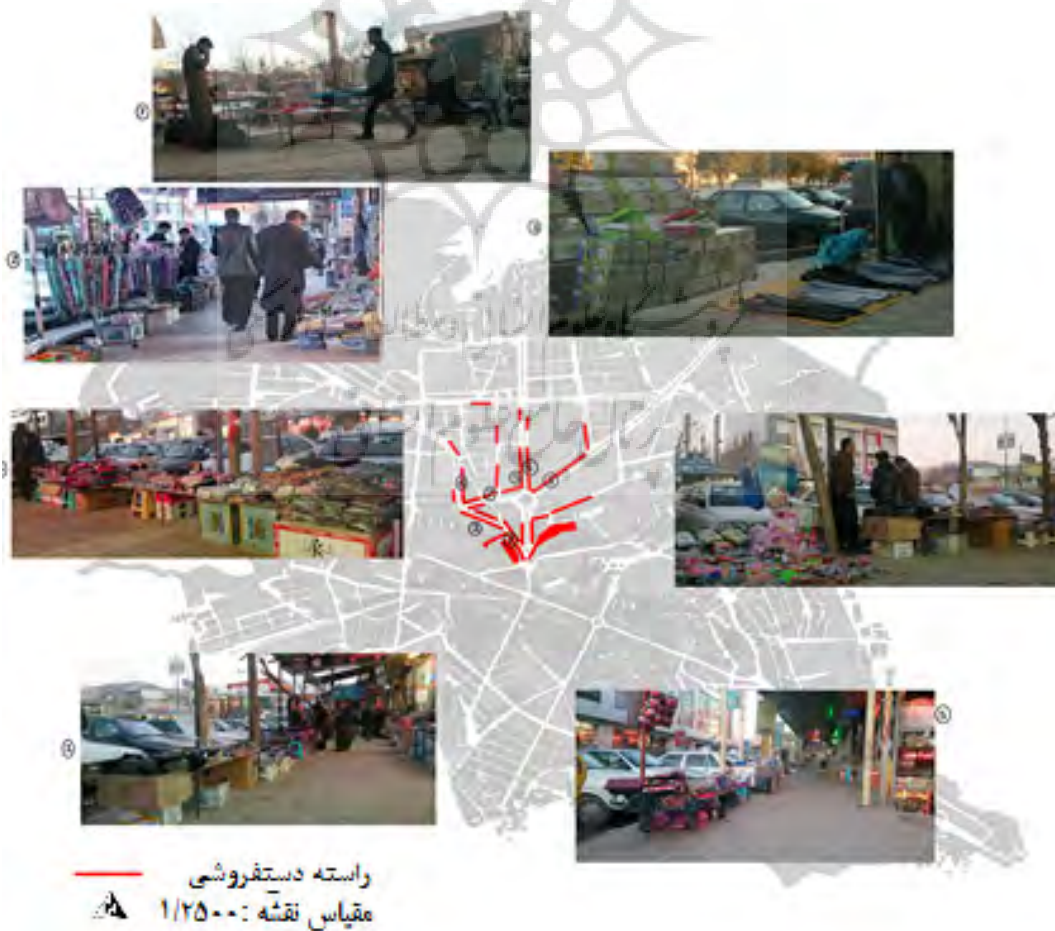
نقشه ۳: راسته‌های دستفروشی در شهر بانه