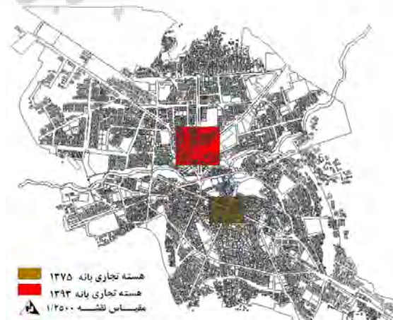
نقشه ۱: تغییرات هسته مرکزی شهر بانه

دومین موردی که می‌توان بدان اشاره نمود، وجود دستفروشان و دوره‌گردان در محدوده مرکزی شهر بانه می‌باشد. بر اساس مشاهدات میدانی و مطالعاتی که قبلاً در این زمینه انجام شده است، بیشتر آنها در محدوده مرکزی شهر بانه اقدام به دستفروشی می‌کنند. طبق مطالعات میدانی محقق در تعدادی از این دستفروشی‌ها سود حاصل بسیار بیشتر از مغازه‌داران در مجتمع‌های تجاری است و به دلیل ماهیت شغلی (که دارای ویژگی‌هایی همچون ورود آسان، سرمایه کم، عدم نیاز به پرداخت اجاره بها و مهم‌تر از همه ورود کالاهای قاچاق به این شهر است) زمینه را برای رشد مشاغل غیررسمی و دستفروشی مهیا می‌نماید. دسترسی آسان به کالاهای قاچاق، ورود آسان به این مشاغل و