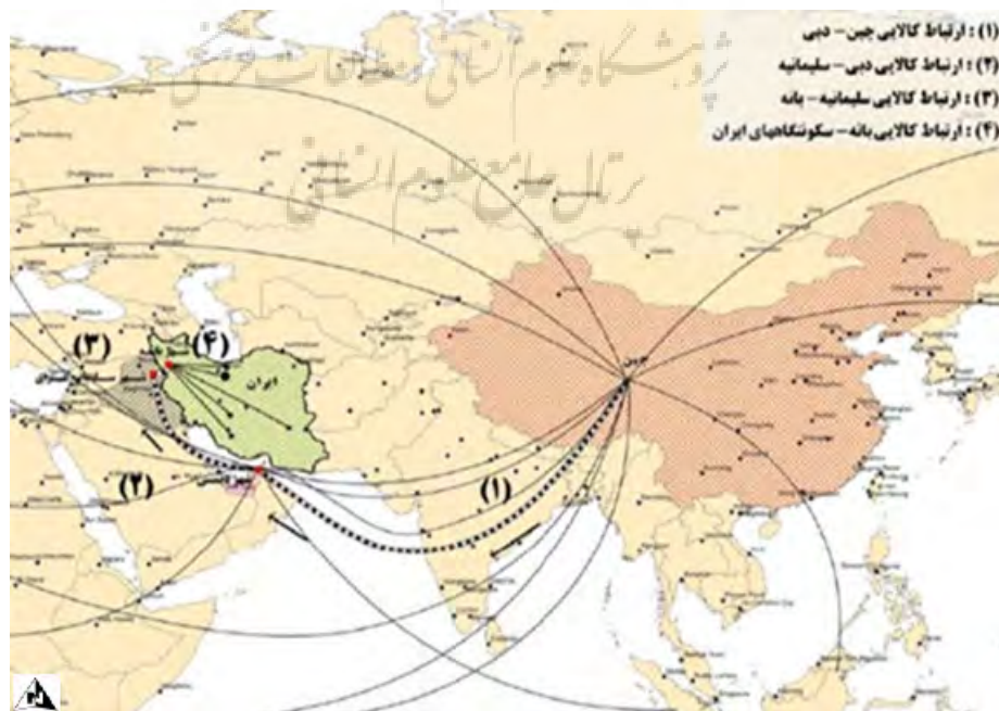
تصویر ۱: جریان فضایی مبادلات کالای غیررسمی به شهرستان بانه - منبع: (Kheyroddin & Razpour, 2014)