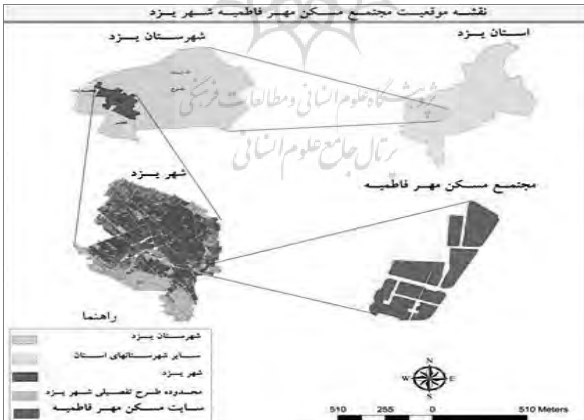
تصویر ۲: موقعیت محدوده مورد مطالعه (ترسیم: نگارندگان)