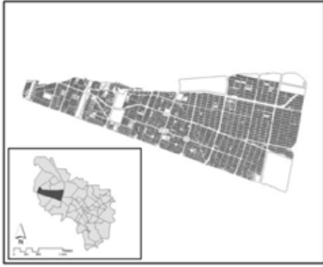
نقشه ۱- محدوده مورد مطالعه، منطقه ۱۱ شهرداری مشهد