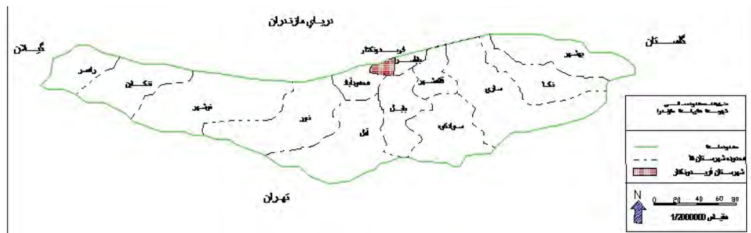
نقشه موقعیت شهرستان فریدونکنار در استان مازندران

است، داده ها و اطلاعات مورد نیاز برای انجام تحقیق از طریق مطالعه کتابخانه‌ای و عملیات میدانی، به دست آمده و پردازش شده است. همچنین از مدل‌های آماری ضریب آنتروپی (شانون و نسبی)، در این تحقیق استفاده شده است.