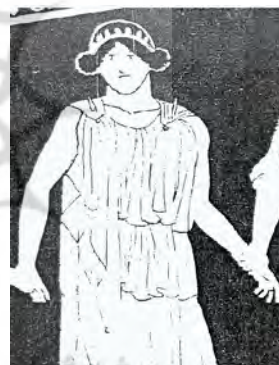
عکس ۸- نمونه‌ای از به‌کارگیری سنجاق عکس ۹- استفاده از سنجاق لباس در لرستان لباس در یونان (Yildirim, Recep, 1989) (Marcus, 1994: 8)