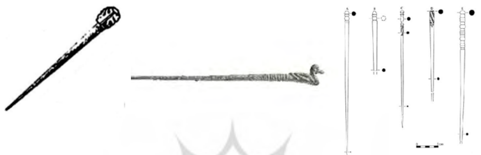
عکس ۶- سنجا با تارک غیرفلزی از گیان Contenau & (Ghirshman, 1935)

18-38: 1935)، باباجان (Goff, 1978: 29-30)، بردبال (اورلت، ۱۳۹۲: ۶۰۲-۶۲۳) و سرخ‌دم (Van Loon, 1989: 53). جزئیات و محل قرارگیری سنجا‌های بدست آمده از برخی محوطه‌های مورد مطالعه را می‌توان در جدولش ۱ مشاهده کرد.