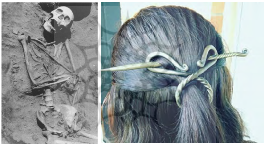
عکس ۱۰- نمونه‌ای از سنجاق موهایی که در جوامع سنتی - عکس ۱۱- سنجاق کفن ( Marcus, 1994: 6) مورد استفاده قرار می‌گیرد

سنجاق‌های میله‌ای عصر آهن فلات ایران نیز با توجه به ابعاد و همچنین تیزی نوک آن در اکثر نمونه‌های مورد بررسی بسیار شبیه میخ‌ها و سوزن‌های فلزی و همچنین مارغن‌هایی هستند که برای دفع ارواح و موجودات اهریمنی استفاده می‌شدند. همچنین استفاده عمده از دو فلز مفرغ و آهن در ساخت این سنجاق‌ها؛ با توجه به ویژگی دفاعی و ضد اهریمنی این دو فلز، می‌توان سنجاق‌های میله‌ای عصر آهن فلات ایران را وسایل و طلسم‌هایی برای دفع ارواح و اجنه دانست که توسط مردمان عصر آهنی، هم در محوطه‌های ساختمانی و هم در کنار مردگان خویش در قبور قرار می‌داده‌اند.