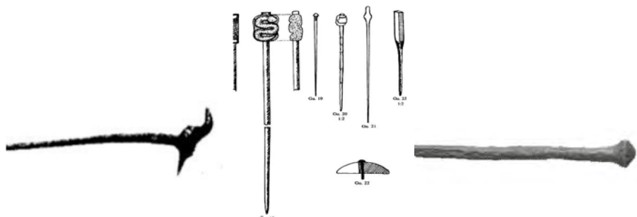
عکس ۳- سنجاق میله‌ای با سر قالبی به شکل پرنده از محوطه اسلامی نیشابور (شریفیان و ده پهلوان، ۱۳۸۷: ۴۰)