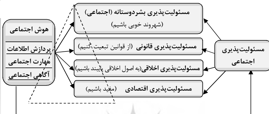
شکل شماره ۱. مدل مفهومی تحقیق و هرم مسئولیت پذیری کارول (۱۹۹۱)