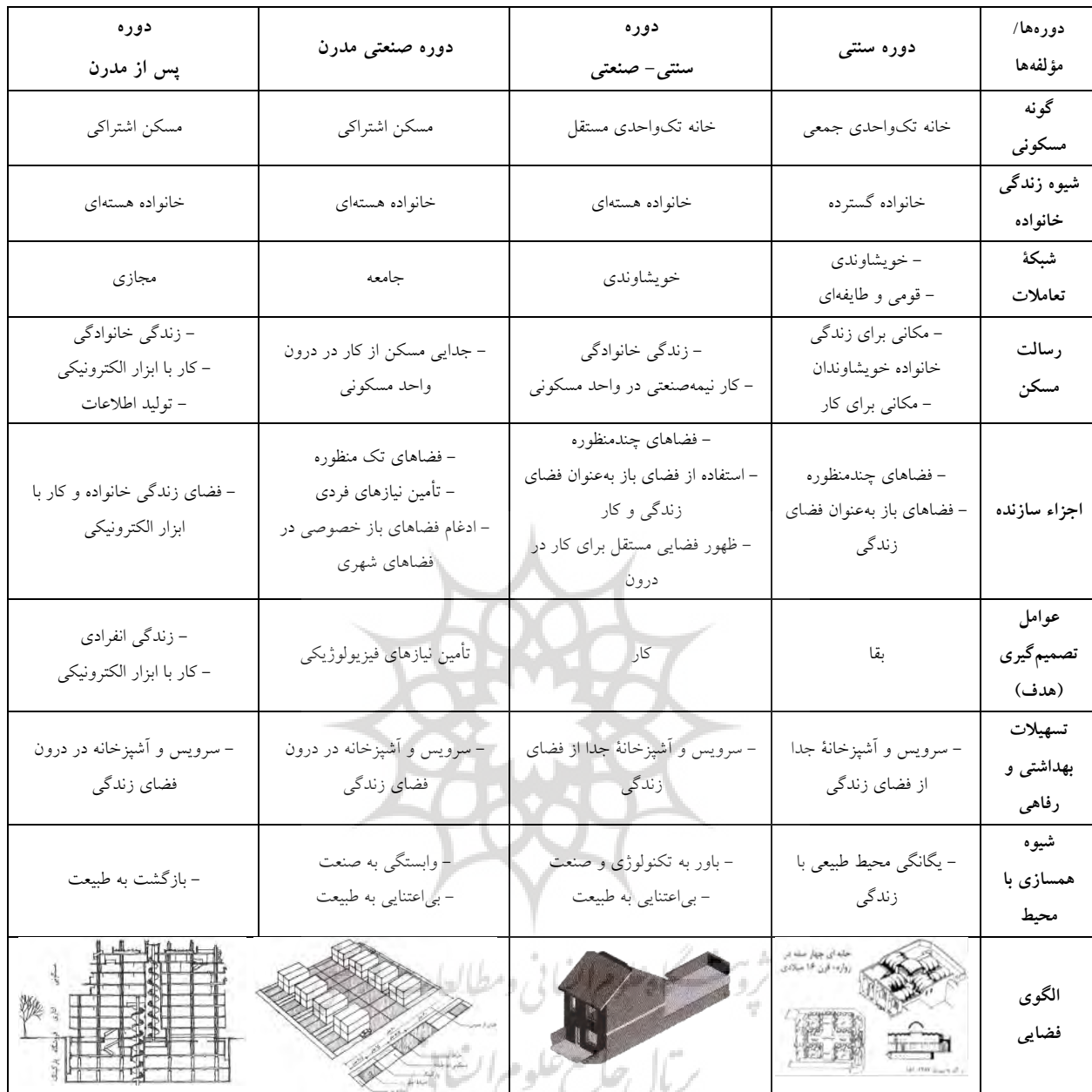
جدول ۳: ویژگی‌های «مسکن» در ادوار مختلف (Pourdeihimi 2012) Table 3: Properties of "Housing" in Different Periods (Pourdeihimi 2012)

«ارزش‌ها، معانی ذهنی انسان و قابلیت‌های محیط»، محیط ساخته‌شده را متأثر می‌سازد و به‌طور پیوسته تغییر می‌دهد. از دیدگاه آن‌ها، سازگاری انسان و محیط، مسئله‌ای خلاق محسوب می‌شود و رکن مهم آن انطباق پیوسته «قابلیت» و «معنی» است. زیرا تغییرات محیط ساخته‌شده، انعکاسی از ارزیابی و انطباق پیوسته «قابلیت-معنی» هستند. الهی زاده و سیروسی (Elahizadeh and Sirusi 2014) نیز در پژوهش دیگری با عنوان «الگوسازی مسکن بر پایه سبک زندگی