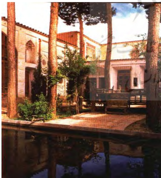
تصویر ۲: تجلی حقیقت «حیات طیبه» در «حیاط مسکن ایرانی

صورت مسکن سستی در فضاهای عملکردی و هندسه آشکار خلاصه‌شده است لیکن سیرت باطنی آن نیز ناشی از یک حقیقت برتر است که در فطرت انسانی وجود دارد. فطریاتی درزمینه خواست‌های انسانی که در مسکن سستی پنهان شده و به وجود درونی انسان نزدیک شده است. این خانه، با فطرت وجودی انسان از جمله عوامل اساسی تکوین سیرت مسکن سستی و شکل‌گیری اصول و مبانی ساختاری و نهانی آن است (Afhami and Soltani 2012).