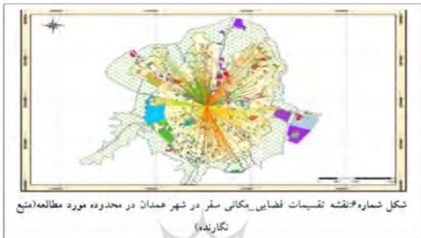
شکل شماره ۶: نقشه تقسیمات فضایی مکانی سفر در شهر همدان در محدوده مورد مطالعه

مؤلفه‌های موجود، احداث مسیر کمربندی یا حلقوی به موازات بافت قدیمی جهت تراکم ترافیکی بالاترین تأثیر را داشته است.