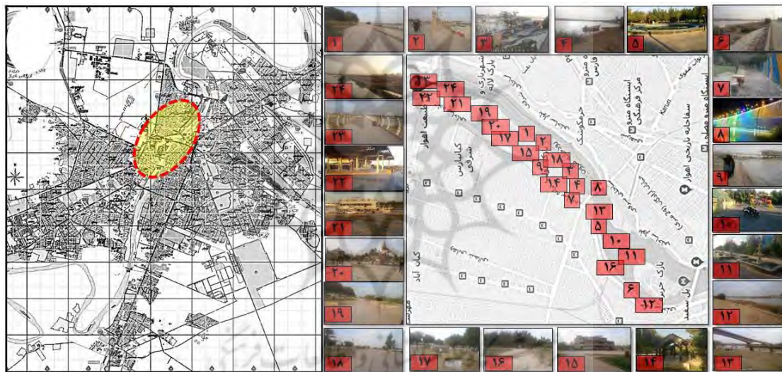
Fig. 2 Map of Ahvaz and study area

اهواز یکی از شهرهای ایران است و به عنوان مرکز استان خوزستان شناخته شده است. یکی از مهم‌ترین پتانسیل‌های گردشگری- تفریحی شهر رودخانه کارون است. با توجه به کشیدگی شمال به جنوب و فاصله‌ای که به‌واسطه عرض زیاد خود داشته است شهر را به دو حوزه شرقی - غربی تقسیم کرده است. کارون به‌عنوان لبه‌ای قوی معرف اصلی شهر اهواز است اما با نادیده گرفتن پتانسیل کارون، جانمایی فعالیت‌های خاص در کنار آن تا حدودی بی‌ارتباط با یکدیگر، به شکل محدودیت درآمده و تنها اکتفا به پل‌های عبوری برای اتصال پهنه شرق و غرب رودخانه صورت گرفته است. این در حالی است که با توجه به نیاز شهر به فضاهای عمومی با استفاده از زمین‌های بایر و قابل بهره‌برداری در مجاورت کارون و به عبارتی استفاده از فرصت‌های ساحلی این رودخانه به طول