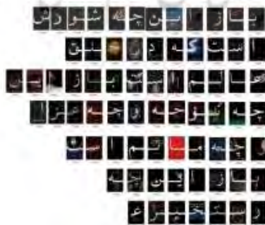
تصویر ۴. اثری به مناسبت ماه محرم با ایده شعری باز این چه شورش است که در خلق عالم است...