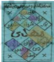
تصویر ۸. پوستری برای عاشقان ظهور، ایده شعری: مه نهان گشته و ایام همه دی شده‌اند...