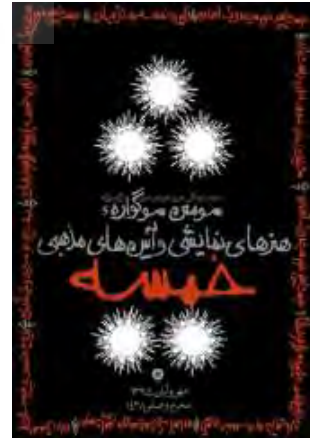
تصویر ۳. پوستر سومین سوگواری هنرهای نمایشی خیمه (پنج تن) ایده شعری: خوشا پنج خورشید و یک آسمان و...