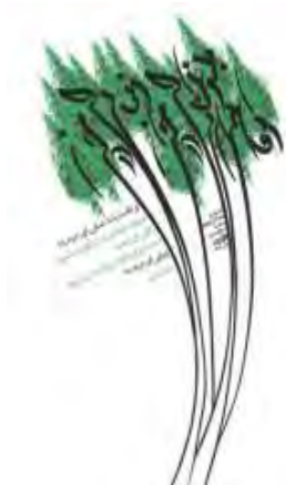
تصویر ۵. اثری با ایده شعری: تو قامت بلند تمنای ای درخت!...