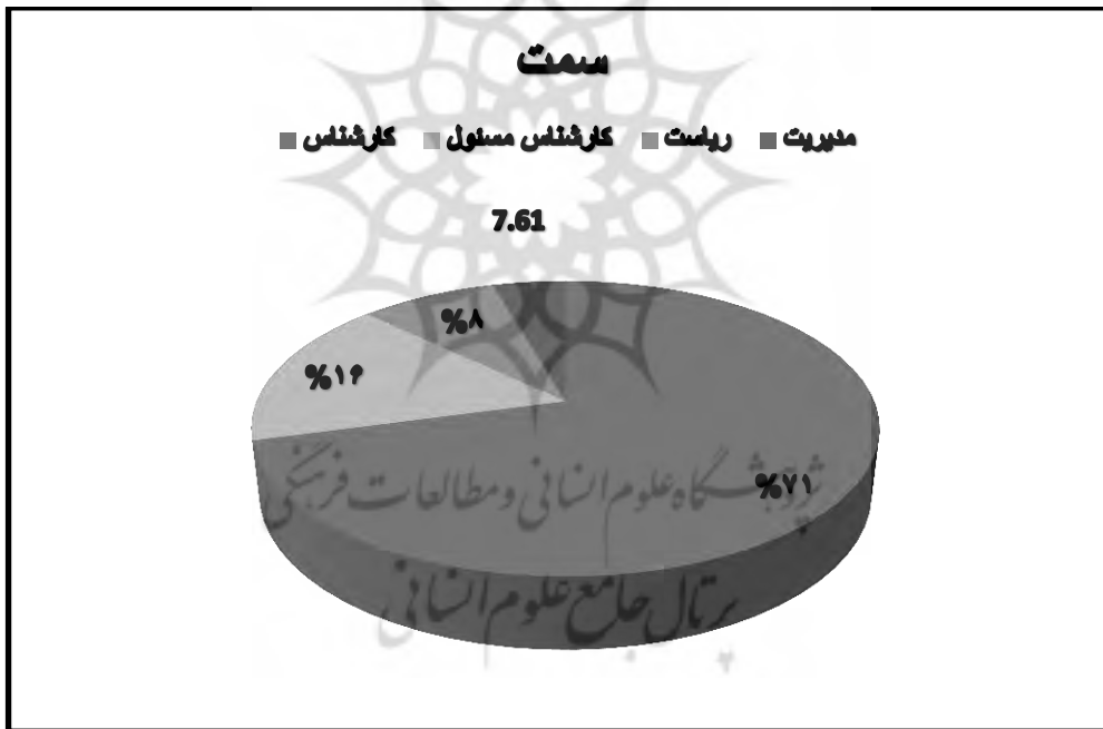
نمودار ۲. توزیع فراوانی نمونه بر حسب سمت

همان طور که در نمودار دایره‌ای شماره ۲ مشاهده می‌شود؛ (۷۱ درصد) از پاسخ دهندگان کارشناس، (۱۶ درصد) از ایشان کارشناس مسئول، (۸ درصد) ایشان رئیس و (۷,۶۱ درصد) ایشان دارای سمت مدیریت بوده‌اند.