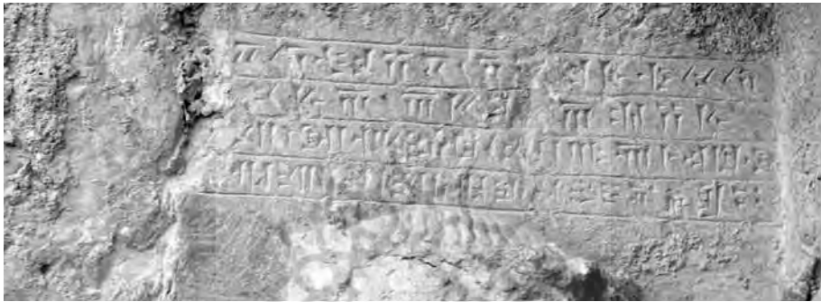
تصویر ۴. کتیبه Dnf از روبه‌رو (عکس از محمدعلی مصلی نژاد، مورخه هفتم بهمن ۱۳۹۷).

نقش برجسته را نتوان بازجست (نسخه انگلیسی مقاله، تصاویر ۱۳-۱۴). با توجه به مطالب بالا ما نمی‌توانیم به‌طور قطع بر وجود DNg شهادت دهیم؛ هرچند که بنابر اصل قرینه‌سازی هخامنشی چنین کتیبه‌ای می‌توانسته در قرینه DNd باشد. پژوهش‌های بیشتر با تجهیزات مناسب بر روی سطح آرامگاه شاهی ممکن است اثبات کند که آیا کتیبه‌ای دیگر در زیر کتیبه Dnf وجود داشته است یا خیر.