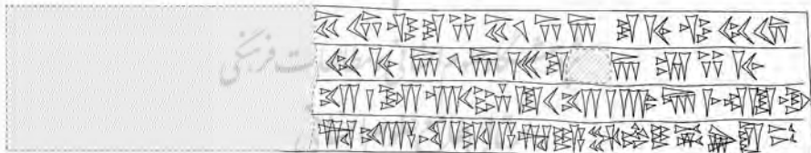
تصویر ۵. ترسیم خطی از کتیبه Dnf (طراح: مانده‌السادات پزشک).